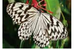
県蝶 オオゴマダラ

(方言名 = グルクン) 色彩豊かな25cm前後の美しい魚で、熱帯性で沖縄からインド洋にかけて分布しています。沖縄では数少ない大衆魚として広く県民の食卓で親しまれています。