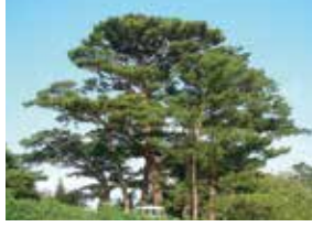
県木 リュウキュウマツ

マメ科の落葉大喬木で原産はインドです。小枝の先端から花枝に総状花序をなし、深紅色で燃えたつように美しい花が3月から5月頃に咲きます。また幹材は、琉球漆器の材料として用いられています。