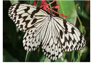
県蝶 オオゴマダラ

(方言名 = グルケン) 色彩豊かな25cm前後の美しい魚で、熱帯性で沖縄からインド洋にかけて分布しています。沖縄では数少ない大衆魚として広く県民の食卓で親しまれています。