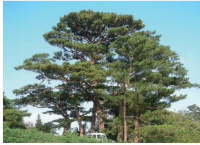
県木 リュウキュウマツ

マメ科の落葉大喬木で原産はインドです。小枝の先端から花枝に総状花序をなし、深紅色で燃えたつように美しい花が3月から5月頃に咲きます。また幹材は、琉球漆器の材料として用いられています。