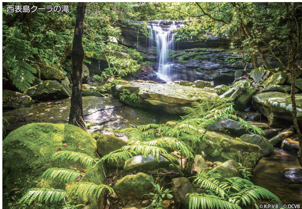
西表島クーラの滝