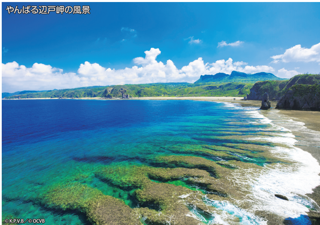
やんばる辺戸岬の風景