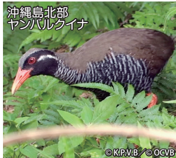
沖縄島北部 ヤンバルクイナ