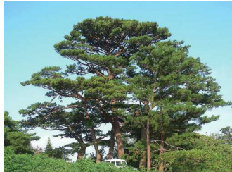
県木 リュウキュウマツ

マメ科の落葉大喬木で原産はインドです。小枝の先端から花枝に総状花序をなし、深紅色で燃えたつように美しい花が3月から5月頃に咲きます。また幹材は、琉球漆器の材料として用いられています。