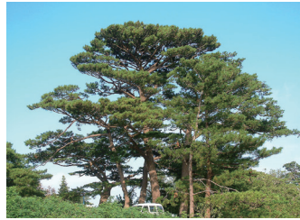
県木 リュウキュウマツ

マメ科の落葉大喬木で原産はインドです。小枝の先端から花枝に総状花序をなし、深紅色で燃えたつように美しい花が3月から5月頃に咲きます。また幹材は、琉球漆器の材料として用いられています。