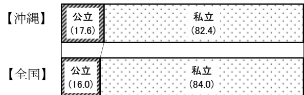
図6 設置者別園数の構成比 (%)