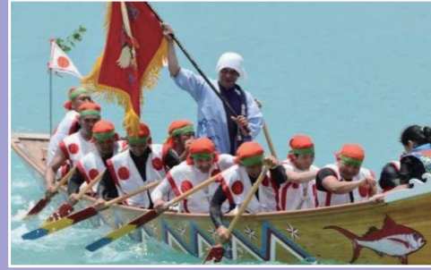
【集落部門】糸満市喜屋武自治会 「喜屋武ハーリー」 伝統文化を次世代へ繋ぐふるさとづくり