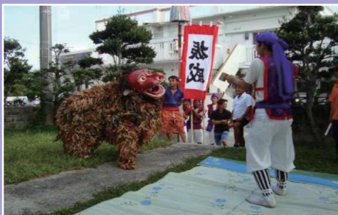
【集落部門】読谷村伊良皆自治会 「十五夜アシビ」 伊良皆アシビで想いを繋ぐふるさとづくり