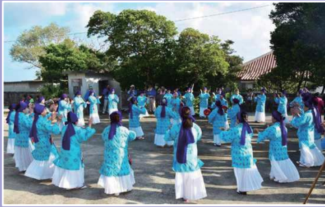
【集落部門】糸満市米須自治会 「米須ウシデーク」 「もの・こと・ひと」が融和したふるさとづくり