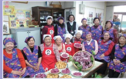
【生産部門】読谷村JAおきなわゆんた支店女性部 「加工品開発」 規格外野菜を使ってふるさとづくり