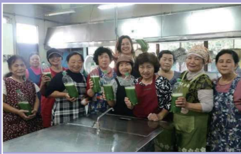
【生産部門】恩納村農山漁村生活研究会 「加工品開発」 地産地消促進・食文化継承・生きがい探しのふるさとづくり