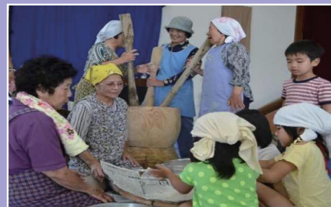
【集落部門】宮古島市いけま福祉支援センター 「いけまシマ学校」 アマイ・ウムクトウを学び活かしたふるさとづくり