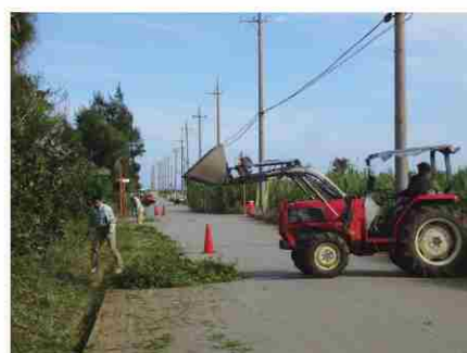
多面的機能支払交付金 伊計農道清掃