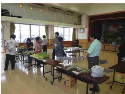
うまんちゅかつちん朝市