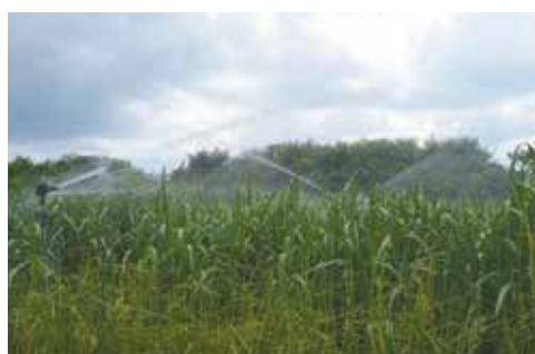
スプリンクラー散水状況