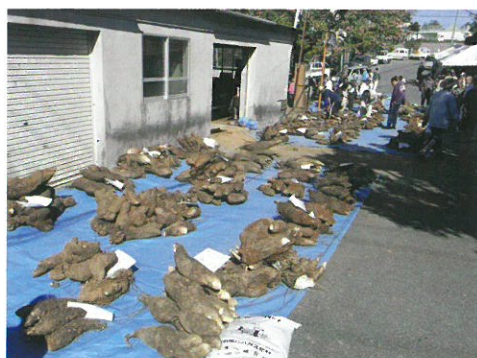
山城區山芋スープ