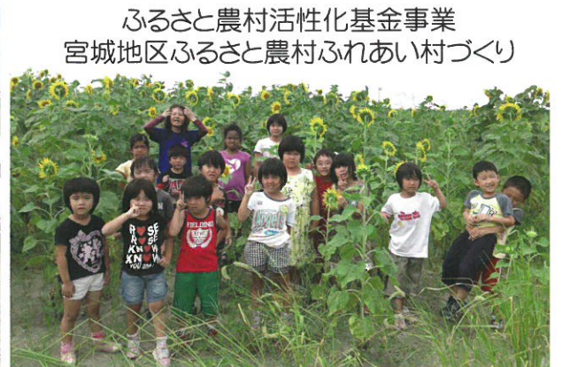
ふるさと農村活性化基金事業 宮城地区ふるさと農村ふれあい村づくり