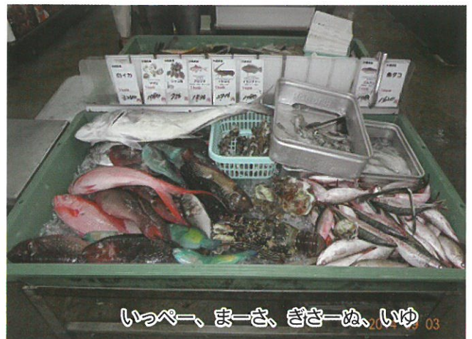
いっぺー、まーさ、ぎさーぬ、いゆ