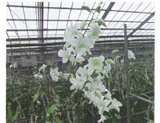
イングリット・バーグマン