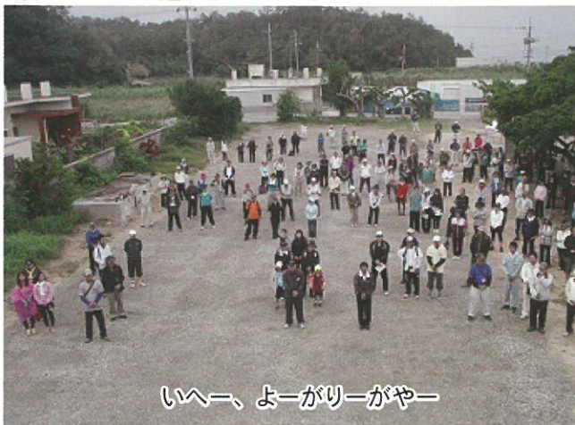
いへー、よーがリーがやー