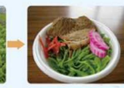
緑性放牧地対策事業(西原町)