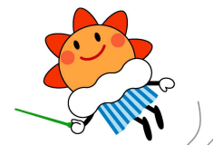
気象庁マスコットキャラクター はれるん

沖縄地方では、1月25日発表の3か月予報での2月の予報に比べ、寒気の影響を受けにくい見通しに変わったため、高温の可能性が大きくなりました。また、湿った空気の影響を受けにくい見通しに変わったため、少雨の可能性が大きくなりました。