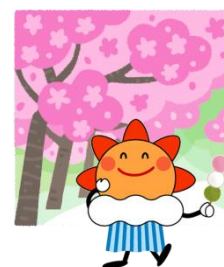
気象庁マスコットキャラクター はれるん