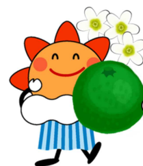
気象庁マスコットキャラクター はれるん