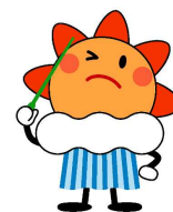
気象庁マスコットキャラクター はれるん