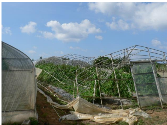
倒壊したビニールハウス

平成19年4月18日午前8時頃、宮古島市では、竜巻による局地的な突風があり、ビニールハウスの倒壊や剥離、サトウキビの倒伏などの被害が発生しました(下写真：4月19日撮影)。