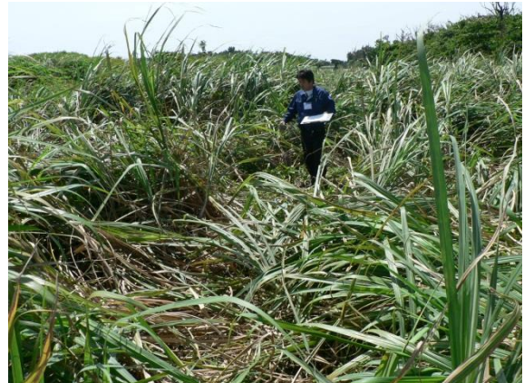
倒伏したサトウキビ