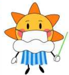
気象庁マスコットキャラクターはれるん