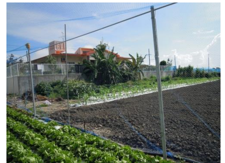
図4 防鳥ネット設置状況(糸満市)