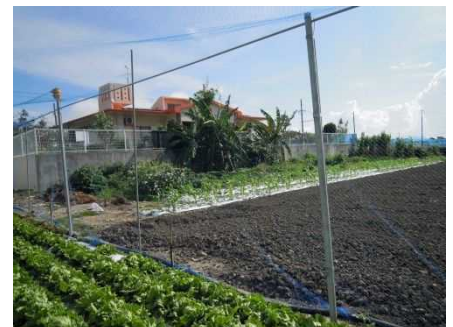
図4 防鳥ネット設置状況(糸満市)