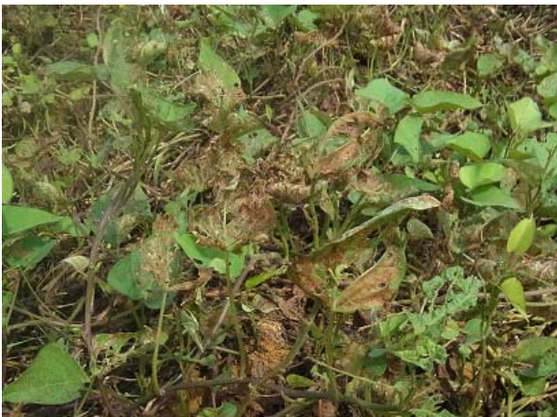
図1 赤く焼けたように見える被害葉