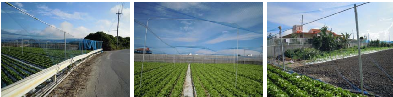
図4. 防鳥ネット設置状況（糸満市）