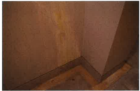
機械室排水溝の状況