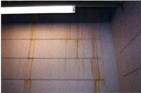
機械室壁漏水跡(錆汁)