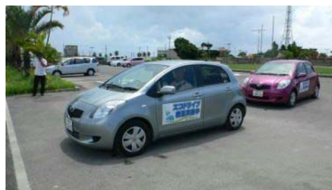
エコドライブ教習会

本県の二酸化炭素排出量は運輸部門が最も高く、中でも交通体系の特性を反映し、自動車からの排出量が運輸部門の6割以上を占めることから、自動車利用に伴う二酸化炭素排出削減の取り組みが重要となっています。