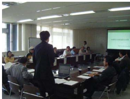
沖縄県地球温暖化防止活動推進員会議

平成17年2月16日の京都議定書発効日に、地域における温暖化防止活動の核として、温暖化の現状やその対策に関する正しい知識の普及や、身近な省エネ対策のアドバイスなどを行う「沖縄県地球温暖化防止活動推進員」35人を委嘱しました。また、その後の追加委嘱で、現在、87名の推進員が普及啓発活動を行っています。（※推進員の任期は3年）