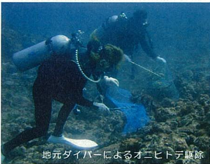
地元ダイバーによるオニヒトデ駆除

サンゴ礁は多様な生きものを育み、美しい景観や漁業・観光資源を支え、また天然の防波堤としても私たちの生活を支えています。私たちも「海のゆりかご」に生まれている一員なのです。