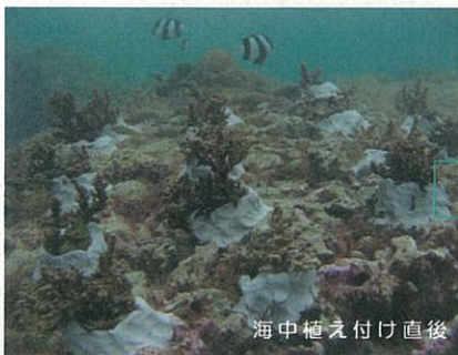
海中植え付け直後

オニヒトデの異常発生、赤土の流出、高水温、大型台風…サンゴ礁が今、重大な危機を迎える中、県内各地で様々な保全の取り組みが行われています。2008年は「国際サンゴ礁年」。日本を始め、世界各地で保全活動の環が一層広がっています。皆さんも、「今」できることから、始めてみませんか。