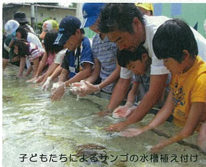
子どもたちによるサンゴの水槽植え付け