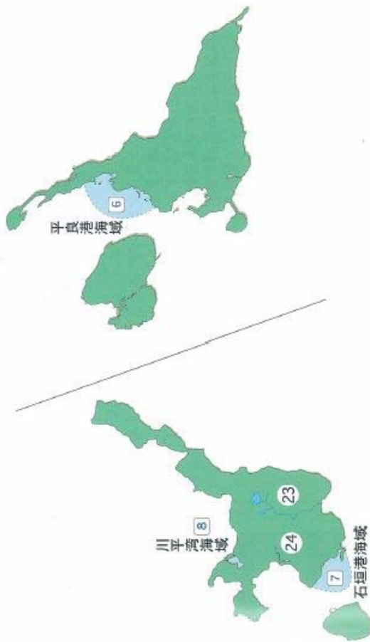
環境基準の水域類型指定状況