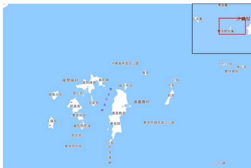
26 図1 区域（慶良間諸島の全域） 27 28