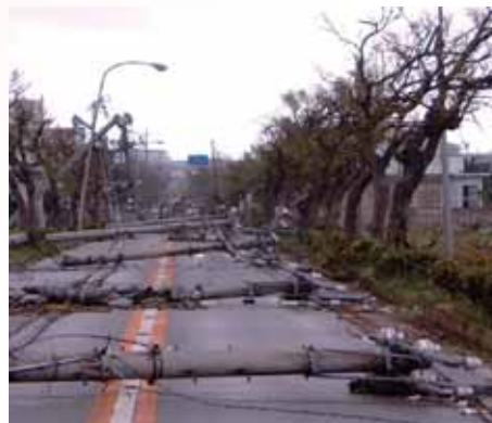
平成15年台風14号による被災

災害による電柱倒壊などへの対策や、地上から電柱及び電線を撤去することによる景観形成などを目的として、電線類の地中化を推進しています。