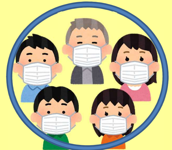
在和年长及有不适症状的家人接触时，佩戴好口罩！