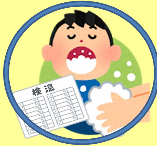
养成洗手、漱口、测量体温的习惯！