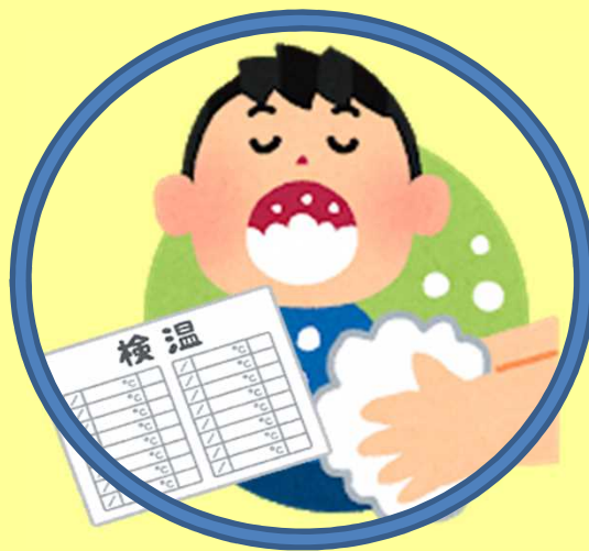
養成洗手、漱口、 測量體溫的習慣！