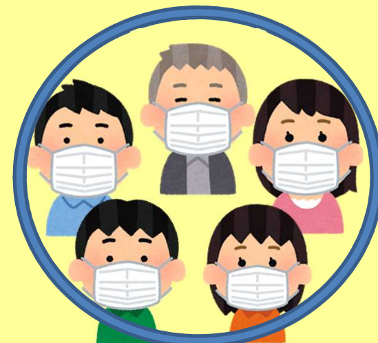
在和年長及有不適症狀的 家人接觸時，佩戴好口罩！