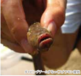
ダイビングチームすなごスナフキン提供