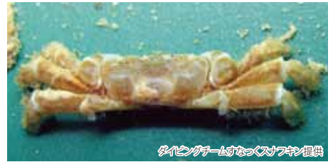
ダイビングチームすなごスナフキン提供