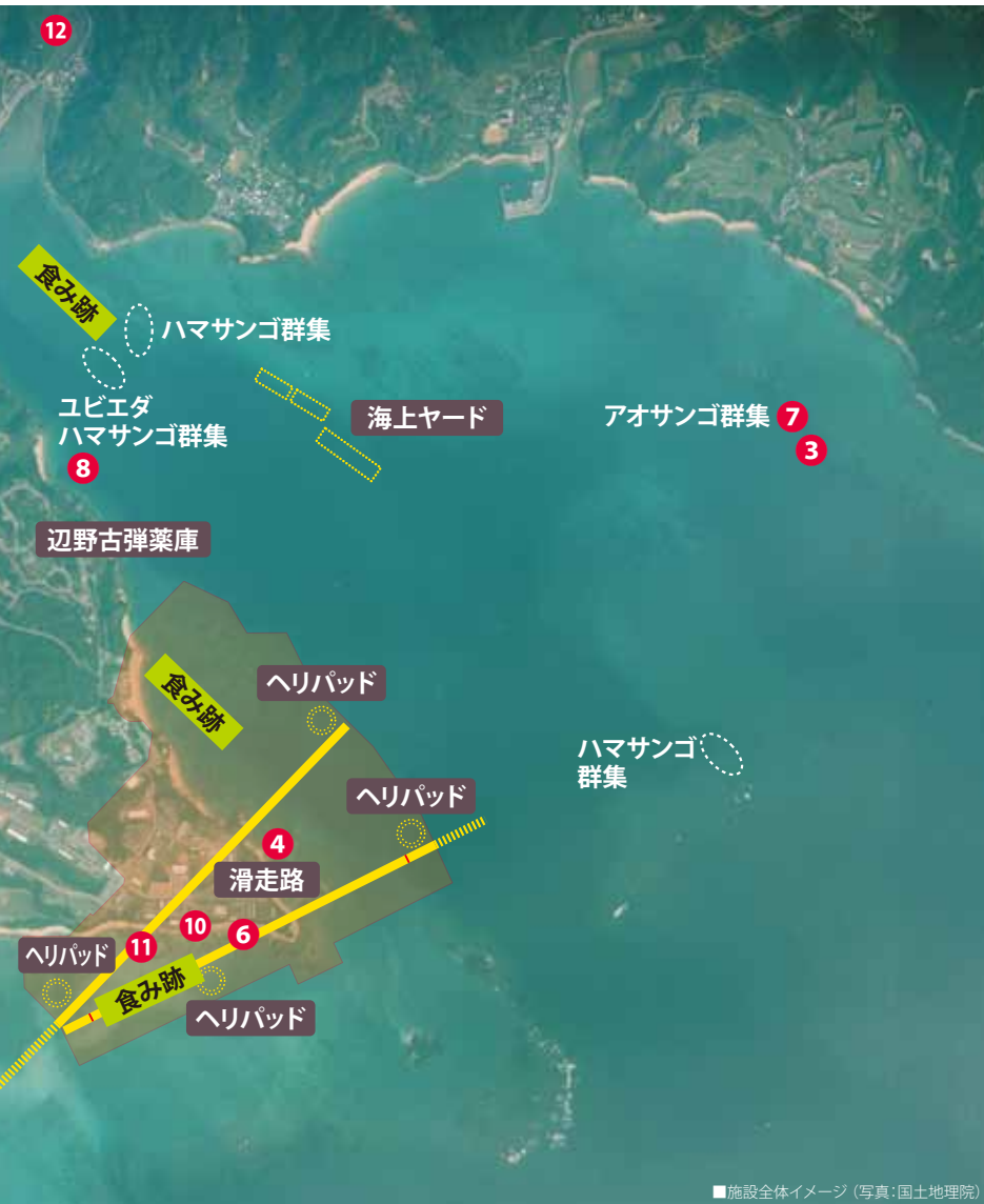
■施設全体イメージ

※上の空中写真(施設全体イメージの写真)は、国土地理院長の承諾を得て、国土地理院撮影の空中写真を複製したものである。(承認番号 平28情復、第1360号)