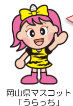
岡山県マスコット「うらっち」