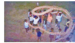
同集落の平成17年の旧暦8月16日の綱引きの様子。人口も減少し綱を持ち運ぶ人員の確保が出来ず綱の長さも短くなっている。