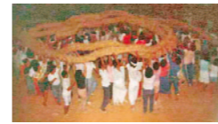
ある集落の昭和50年代頃の旧暦8月16日の綱引きの様子。当時は人口も多く、綱もワラでしっかりと編み込まれている。

市街化調整区域内だと、土地を持つだけでも簡単に家を建てることはできません。農業従事者の住宅や線引き前から元々親が住んでいた市町村に子が分家住宅を建てる場合、線引き前から元々宅地として利用していた場合など、家を建てることのできる要件が限られています。しかし、こうした制限があることから、線引き前からある既存集落では人口が減少し、集落の過疎化、高齢化、衰退といった現象が起きてきています。特に、線引き時点では盛大に行われていた綱引きなどの伝統行事については、現在では人口の減少のため、行事を行うことすらままならない状態になっている集落もあります。