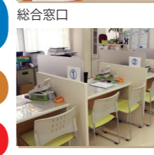
総合窓口 インテーク面談

就職を希望する方はぜひセンターへお越しください。専門のコーディネーターが相談内容を把握して、適切な相談窓口につなぎ、あなたに合った支援をします。