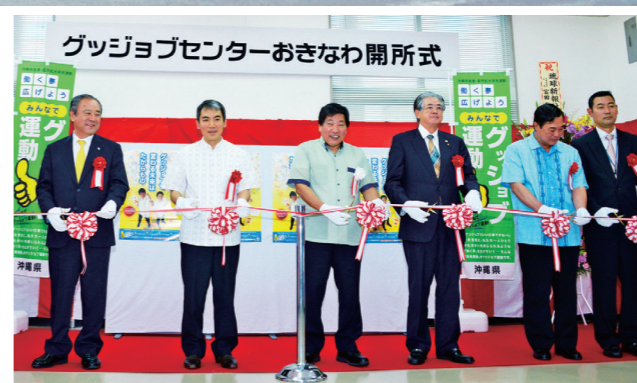
(右) グッジョブセンターおきなわ開所式でのテープカットの様子