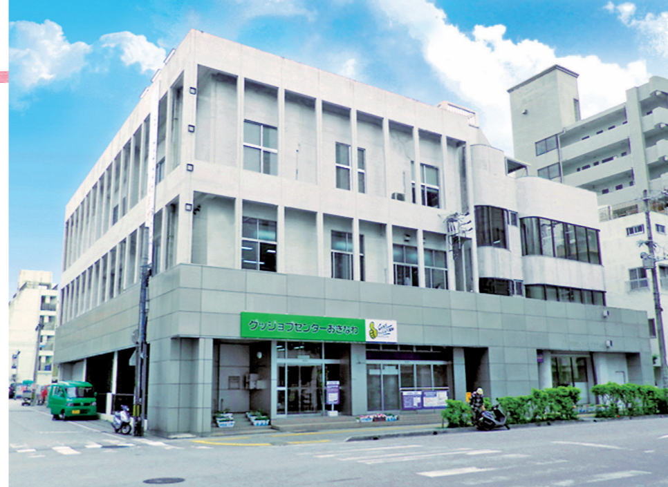
(上) グッジョブセンターおきなわ外観写真