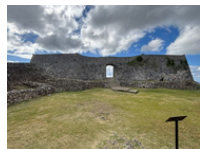
中城城跡 (イメージ)