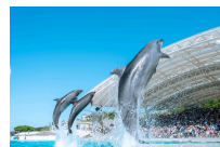
イルカショー (イメージ)