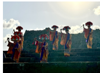
伝統芸能公演 (イメージ)