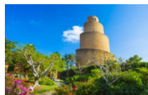
熱帯ドリームセンター (美ら島植物園) (イメージ)