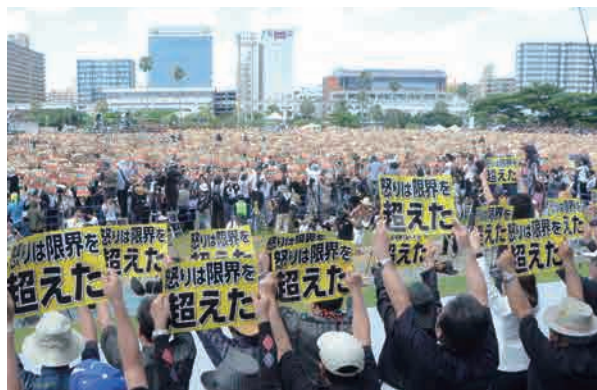
米軍属が逮捕・起訴された事件県民大会 平成28年(2016年)