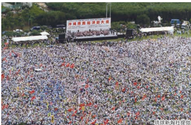
米兵少女暴行事件決起集会 平成7年(1995年)