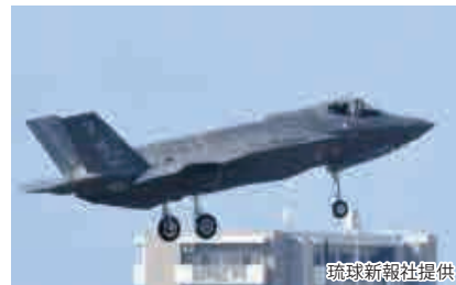
嘉手納飛行場に飛来した外来機(F35)

また、日米両政府は、夜間・早朝の飛行制限や、学校、病院を含む人口が集中している地域上空の飛行を制限することに合意をしていますが、その合意内容は「できる限り」など努力目標にすぎず厳守もされていません。実効性のある航空機騒音の軽減措置が講じられているとは言えない状況です。