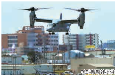
普天間飛行場に配備されているオスプレイ