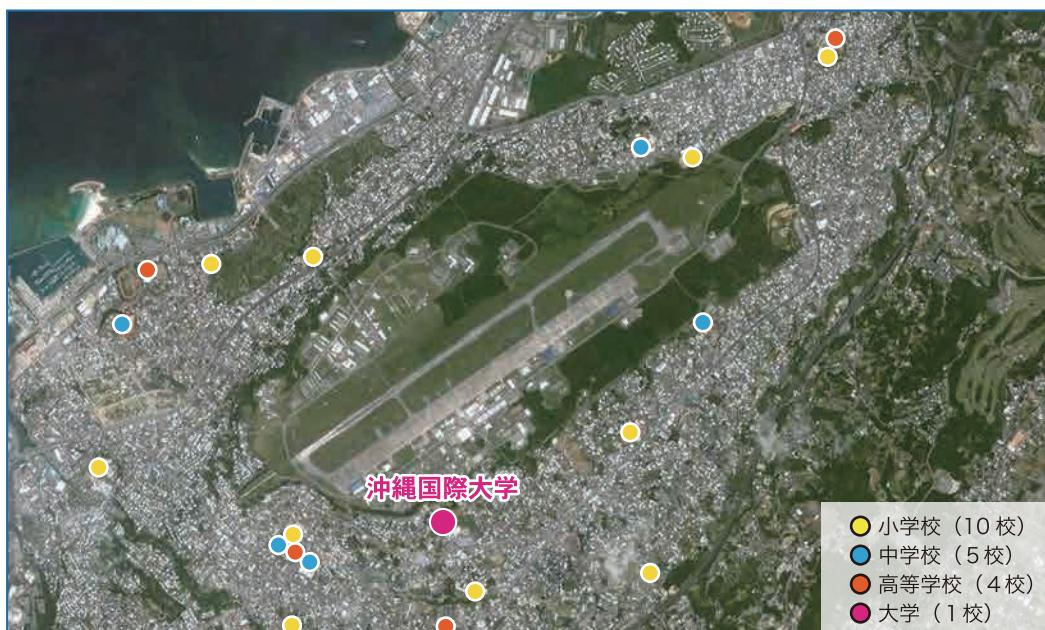
普天間飛行場は、宜野湾市のほぼ中央にあり、同市を東西に分断している。

米軍基地が返還されることで、跡地の有効活用が可能になり、沖縄全体の今後の振興・発展につながっていくことが期待されています。(Q18参照)