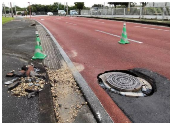
②北谷町道路陥没 ・県道130号線瑞慶覧の ファイヤーステーション近 くで県下水道マンホール周 辺の陥没により1車線規制 中。