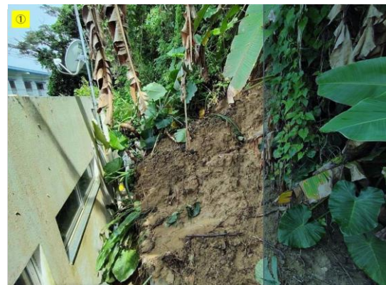
③北中城村土砂崩れ ・北中城村喜舎場で土砂崩 れが発生した。