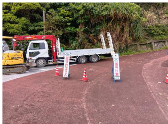
④うるま市土砂崩れ・落石