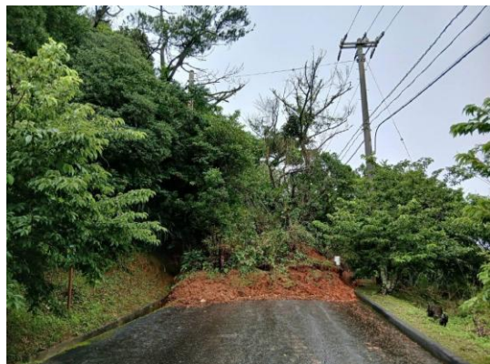
⑤久米島町土砂崩れ ・久米島町儀間29号線 （アーラ林道）で土砂崩れ が発生した