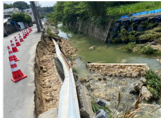
①北谷町吉原道路決壊