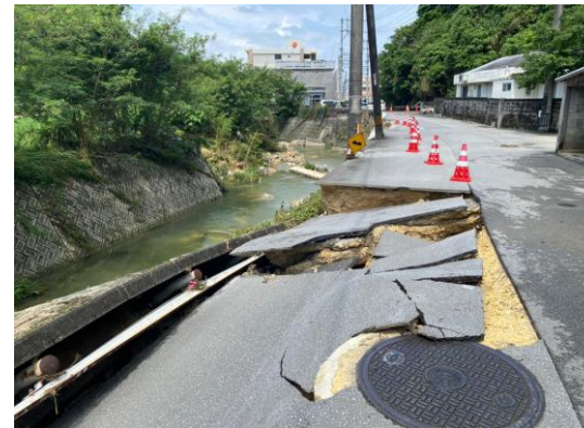
①北谷町吉原道路決壊 ・北谷町吉原で白比川氾濫し、北谷町吉原の道路が決壊