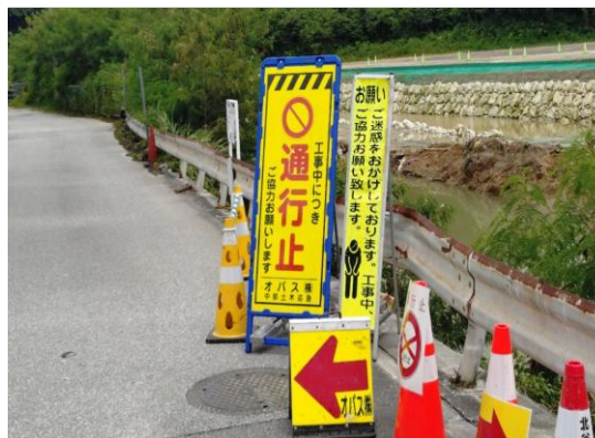
①北谷町吉原道路決壊