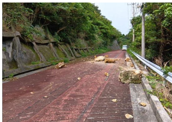
④うるま市土砂崩れ ・うるま市与那城宮城にお いて、土砂崩れや落石が発 生した。