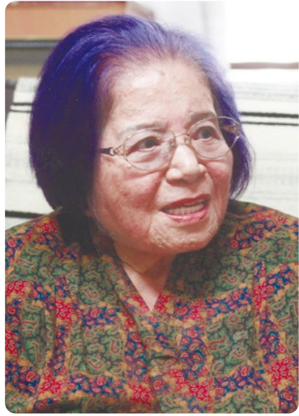
(2024年4月撮影、大城弘明氏提供)