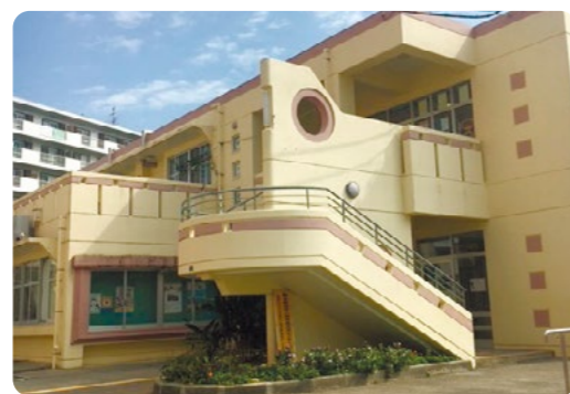
アメリカンスクールが一部部分を貸与され校舎に用いている宜野湾市人材育成センターめぶき=宜野湾市