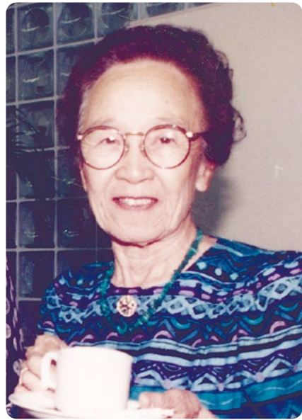
(1996年撮影、沖縄キリスト教学院大提供)