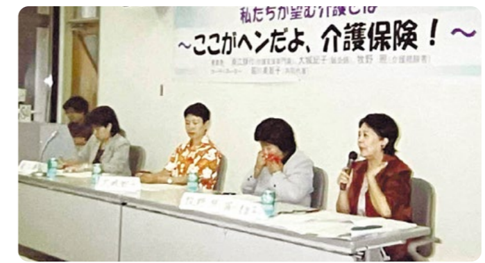
「ここがへんだよ、介護保険」をテーマに介護を考える女性の会主催の第1回ミニシンポジウム=2003年11月1日 県女性総合センターにいる