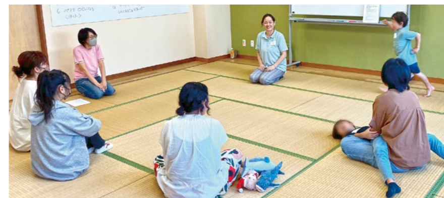
しんぐるまざあず・ふぉーらむ 沖縄主催の親子ワークショップ =2025年11月

げ、制度を現実に即したものにへと改善していく責任がある。同時に、そのための人手や時間、資源が必要であるという現実もある。日々の葛藤を抱えながらも、母親たちと心を共にし、安心して家族が暮らせる社会をつくるため歩んでいる。