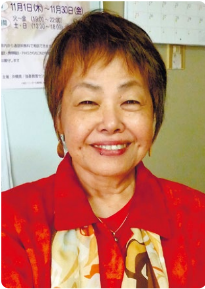
(2012年11月撮影、琉球新報社提供)