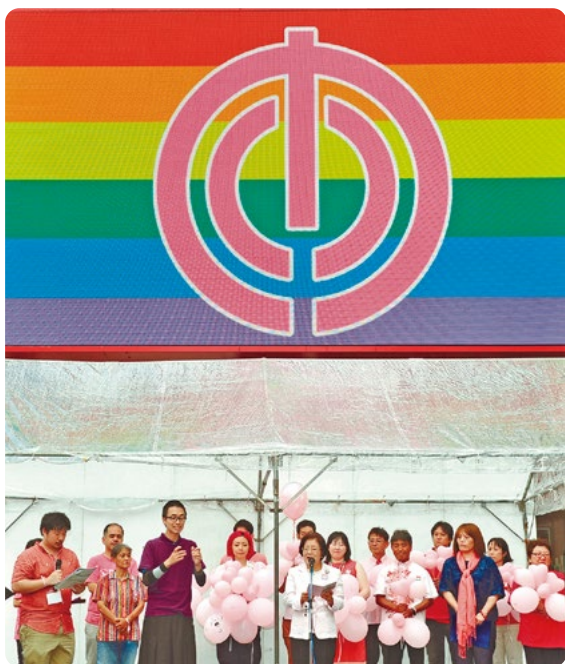
性の多様性を尊重する都市・なは宣言」を読み上げる城間幹子那覇市長（写真中央） =2015年7月19日、那覇市牧志のテンプス館前広場

また、LGBTQの運動や理論が、それまでのフェミニズムの前提を問い直し、ジェンダーに関する視点を更新してきたという関係性もある。例えば「女性」とは誰を指すのか。