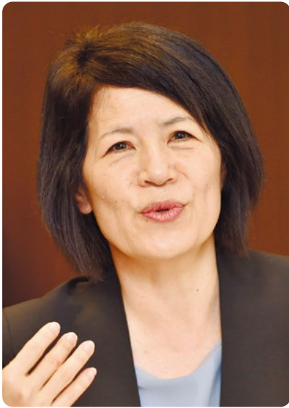
(2019年1月撮影)