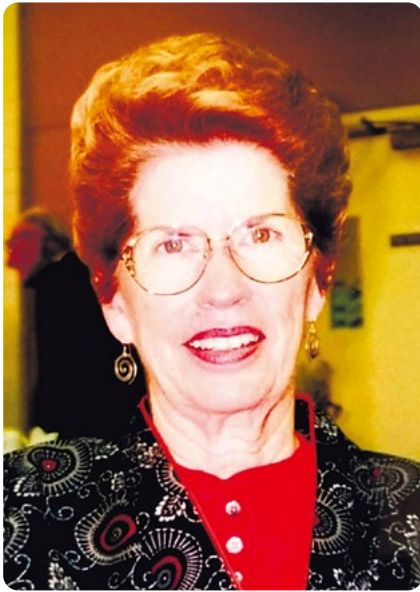
(2000年撮影、ジェニファー・ユシフさん提供)