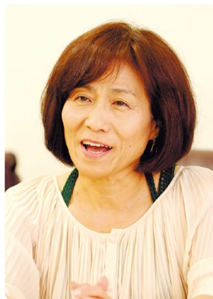
(2012年10月10日撮影、琉球新報社提供)

1953（昭和28）年、島尻郡佐敷村（現南城市）に生まれた。佐敷小学校、佐敷中学校を経て知念高校に。高校を卒業した本土復帰前年の71年、沖縄バスのバスガイドになった。「女子にとっての憧れの職業でした」と期待と夢をふくらませての入社だった。バスガイドの定年が当時27歳ということにもななら疑問も感じていなかったという。