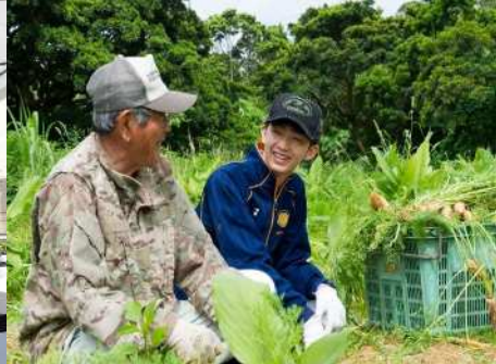
(上) NPO法人おおぎみまるとツーリズム協会