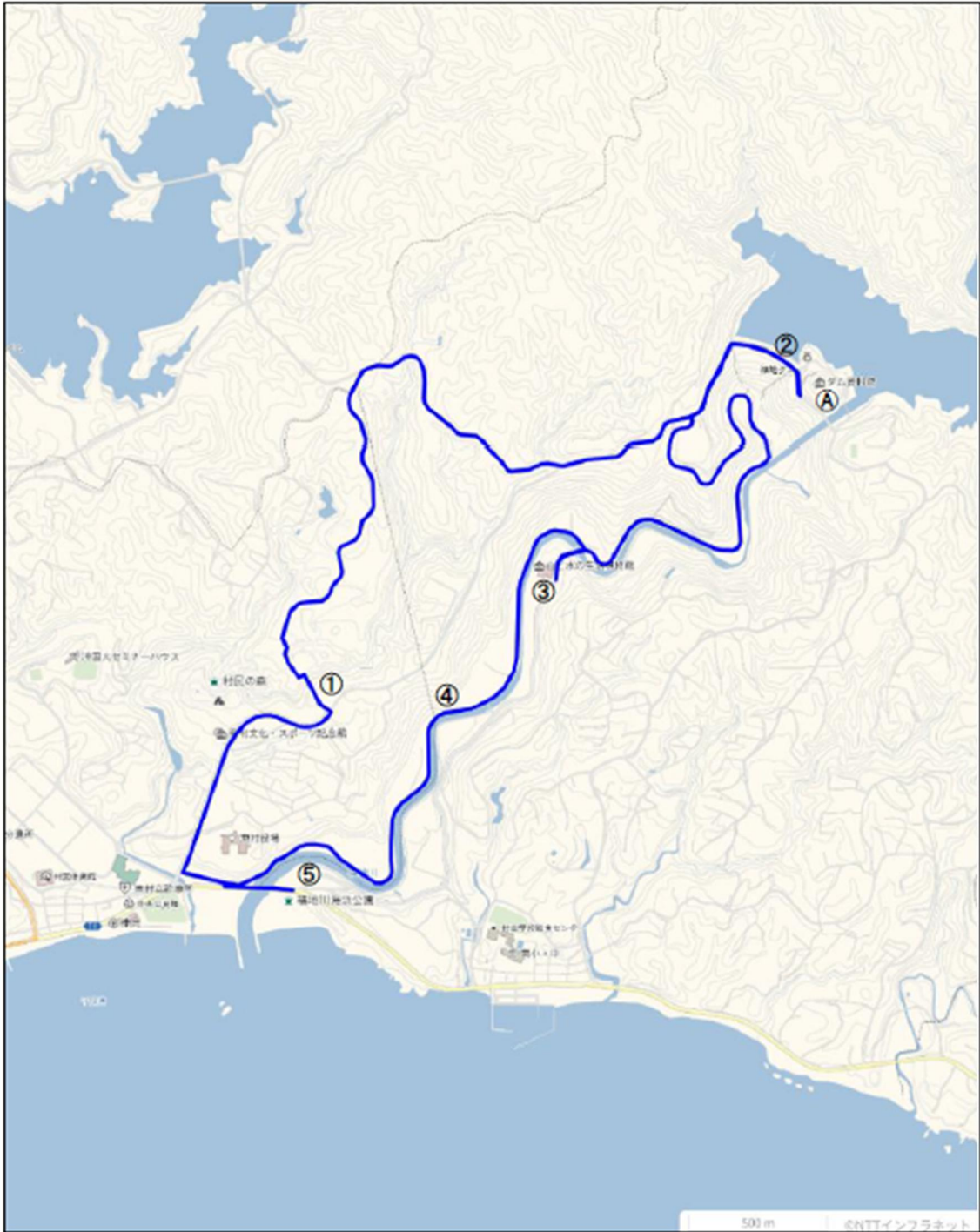
図3 東村におけるコース（青線部分）