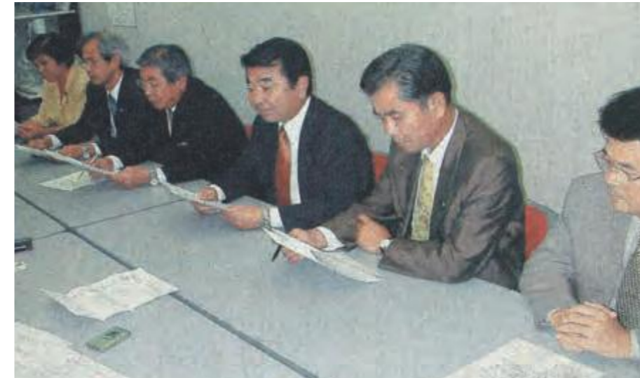
2日間のさとうきび要請行動を終え、記者会見する県議会の代表ら=県東京事務所 (平成12年9月6日琉球新報)