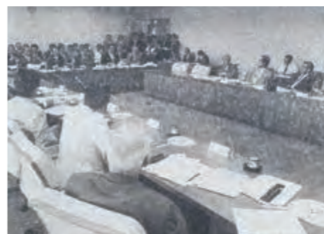
県立那覇国際高校の用地取得議案、国立組踊劇場誘致などの陳情案件を審議した文教厚生委員会 (平成8年7月10日琉球新報)