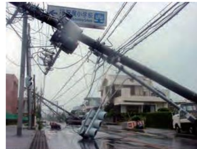
倒壊した電柱。最大瞬間風速は74.1m、被害総額は約133億円に上った。

県議会は、台風被害調査を踏まえ、急施事件として要請決議を第3回議会(臨時会)で議決し、関係省庁等に要請議員団を派遣するなど、議会として「一日でも早く住民が元の生活に戻れるよう」対処した。