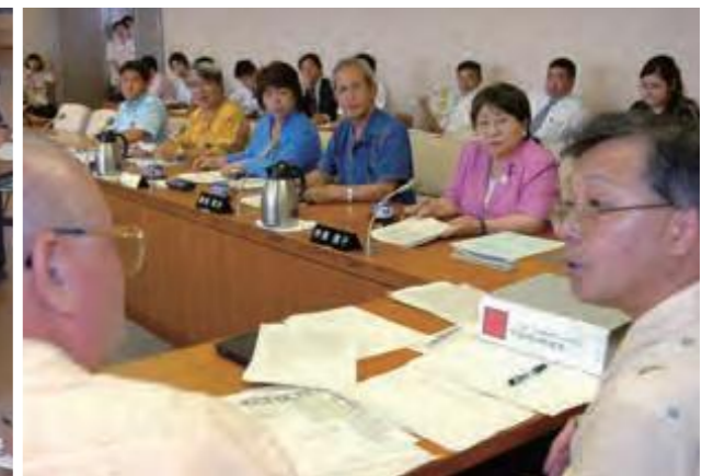
6月19日、議論を尽くし、全会一致で検定意見撤回を求める意見書を採択した文教厚生委員会の委員ら (平成19年9月24日沖縄タイムス)