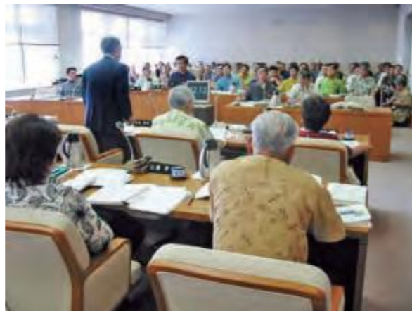
沖縄振興開発金融公庫の存続に係る意見書を協議した決算特別委員会の様子(平成17年10月26日琉球新報)

12月、政府は、同公庫を沖縄振興計画の最終年次である平成23年度まで存続させることを決めた。