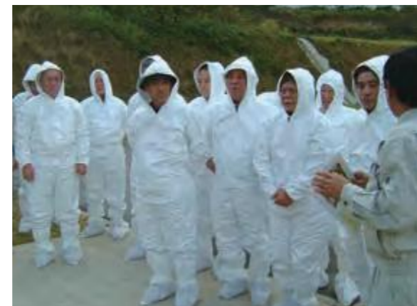
1月12日、県家畜改良センターなどを視察調査する経済労働委員会の委員ら