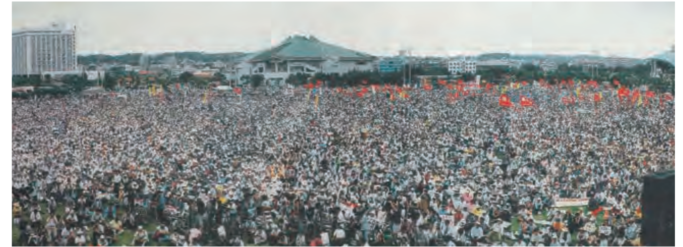
県民総決起大会の様子＝21日午後、宜野湾海浜公園

大会では、暴行事件に対する強い憤りが表明されるとともに、日米地位協定の見直しが採択されるなど、米軍基地問題に対する県民の強い要求が表明された。