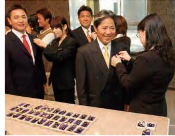
議会事務局職員から議員バッジを付けてもらう(右から)奥平一夫議員、赤嶺昇議員、當間盛夫議員

「観光振興・新石垣空港建設促進」「少子・高齢対策」の2つの特別委員会を新たに設置(7月13日)