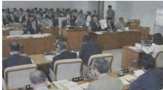
新振興計画の理念や沖縄振興新法についての質疑を行う沖縄振興特別委員会 (平成13年6月11日沖縄タイムス)

県議会では、第三次沖縄振興開発計画の計画期間が平成13年度末までであること、新石垣空港の建設位置をカラ岳陸上に県が正式決定したことなどから、諸問題の調査及び対策の樹立等を行うため、7月7日に「沖縄振興特別委員会」「新石垣空港建設促進特別委員会」の2つの特別委員会を新たに設置した。