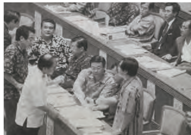
野党議員の質問に答えるため答弁調整する与党議員団=14日午後、本会議場 (平成11年10月15日琉球新報)