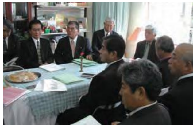
1月26日、保育所運営費や認定こども園条例案などの調査のため、県内の保育所を視察する少子・高齢対策特別委員ら