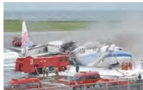
8月20日、消防による消火活動が行われた中華航空機＝那覇空港 (平成19年12月23日沖縄タイムス)