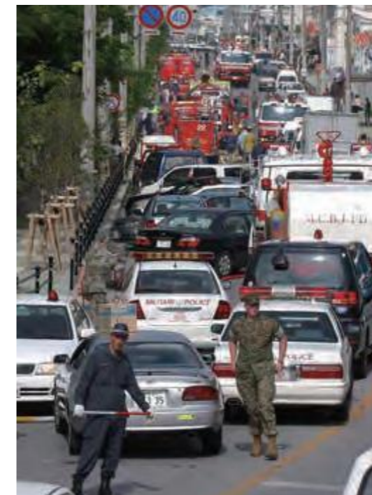
沖縄国際大学構内への米軍ヘリ墜落事故当日の様子(平成17年2月8日沖縄タイムス)