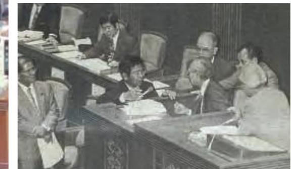
「消費税」で中断した第5回議会 (定例会) (平成8年7月17日琉球新報)