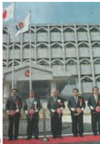
八重山支庁新庁舎の落成式 (平成9年10月23日沖縄タイムス)