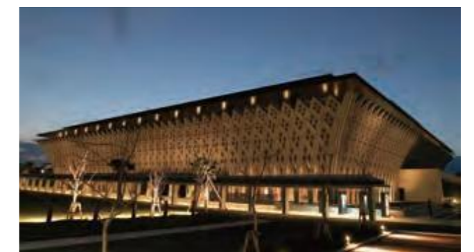
国立劇場おきなわが開館(平成16年12月24日沖縄タイムス)