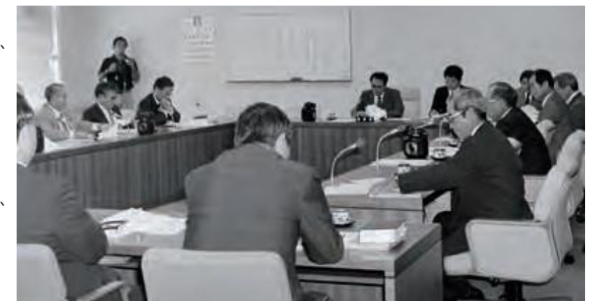
那覇軍港の返還問題等を議論する米軍基地関係特別委員会(平成5年10月14日沖縄タイムス)