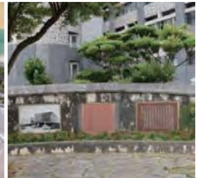
琉球政府立法院跡地(旧議会棟)に建立された銘板