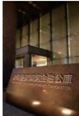
存続が決まった沖縄振興開発金融公庫(平成17年12月2日沖縄タイムス)