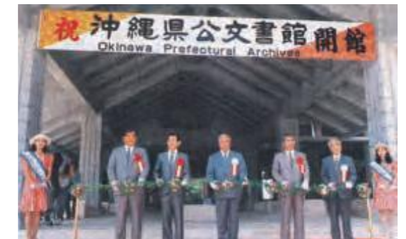
県公文書館の開館式典でテープカットする (左から) 嘉数知賢沖縄県議会議長、稲橋一正国立公文書館長、大田昌秀沖縄県知事、玉城一夫沖縄総合事務局長、宮城悦二郎沖縄県公文書館長 (平成7年8月1日琉球新報)