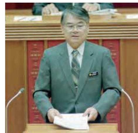
県議会の代表質問で初答弁する稲嶺恵一知事(平成10年12月16日沖縄タイムス)