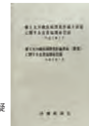
全員協議会の質疑を記録した冊子