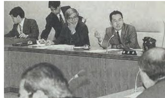
継続審議中の個人情報保護、景観形成の2条例案の取り扱いで話し合った総務企画委員会 (平成6年9月20日琉球新報)

第4回議会(定例会)に提出され継続審査となっていた3議案が、第6回議会(定例会)で議決された。個人情報保護条例は、原案に対して、前文の一部修正と削除請求権を創設することを内容とした修正案が提案され、全会一致で修正議決された。