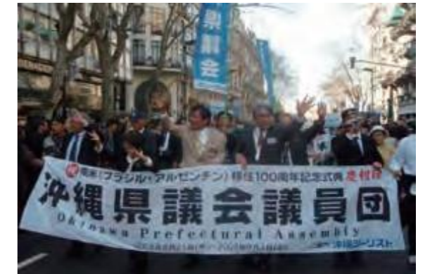
8月、県人移住100周年記念パレードに参加する議員団