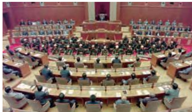
新議会棟へ移転後、最初の本会議。新議場の開場を記念し、琉球古典音楽の演奏が行われた。(平成4年9月25日沖縄タイムス)