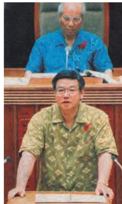
決議の提案理由を説明する翁長雄志議員