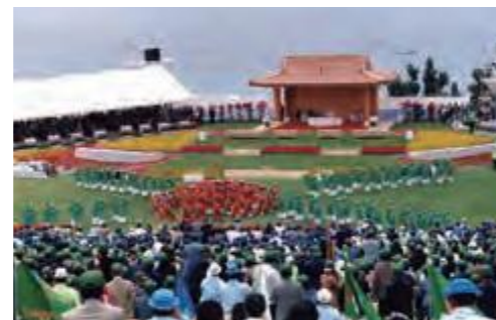
県内外から約1万人が参加した全国植樹祭(平成5年4月26日沖縄タイムス)