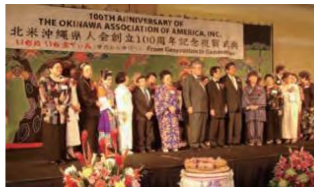
北米沖縄県人会創立100周年記念祝賀式典の様子