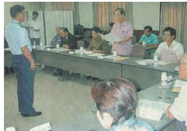
航空自衛隊に危険物の管理徹底などを要請した議員団(平成15年9月19日琉球新報)

8月、爆死した自衛隊員の自宅と借家から米軍対戦車ロケット弾等の危険物が相次いで見つかり、県民に大きな不安を与えた。