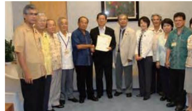
8月26日、さとうきび政策支援等要請のため、知事とともに関係省庁へ要請を行った議員団(写真中央は町村信孝外務大臣)