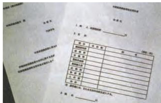
政務調査費の収支報告書(平成16年12月22日沖縄タイムス)