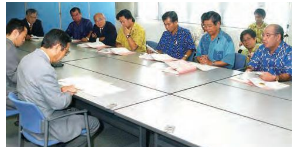
米軍F15戦闘機の墜落事故に対し、米軍機事故の抗議と再発防止を橋本宏大使(手前右)に要請する県議会の代表=外務省沖縄事務所(平成14年9月3日沖縄タイムス)