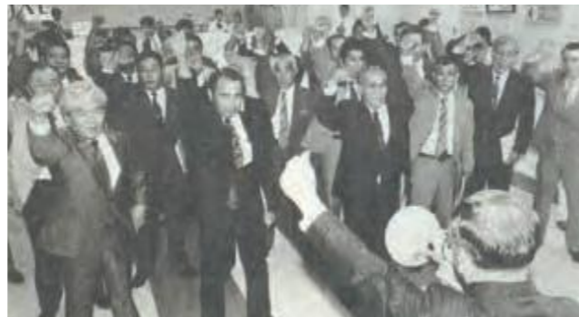
さとうきび価格等の要請に出発する県議会議員、知事、関係団体等の要請団=那覇空港(平成5年10月13日)