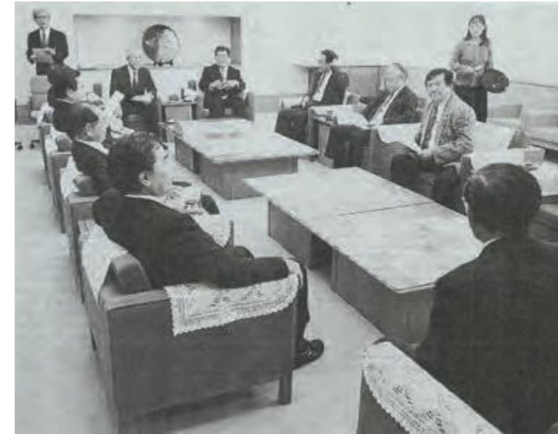
翌年4月から県議会も情報公開の対象にすることを決めた各派代表者会議(平成10年3月25日沖縄タイムス)