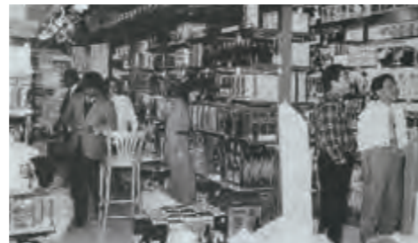
沖縄産の品がずらりと並べられた「わした」の店内 (平成6年3月1日沖縄タイムス)