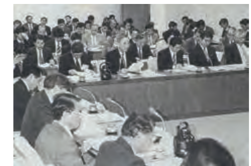
福建・沖縄友好会館の追加負担金問題で深夜まで論議が続いた総務企画委員会 (平成8年12月17日琉球新報)