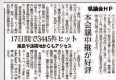
(平成17年7月11日沖縄タイムス)

平成17年6月の第3回議会(定例会)から、本会議のインターネット中継(生中継、録画中継)による映像配信を始める。