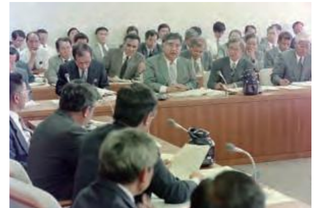
「赤土等流出防止条例」について集中審議する観光振興・環境保全対策特別委員会 (平成6年9月21日沖縄タイムス)