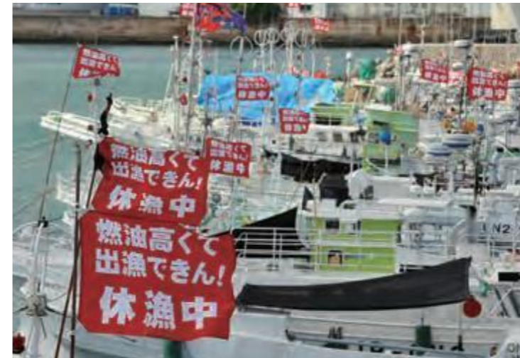
(上) 7月、原油価格高騰を訴え、休漁中の旗を掲げる泊漁港の漁船(平成20年12月25日沖縄タイムス)

沖縄振興・那覇空港整備促進特別委員会を設置 原油高騰対策、WTO農業交渉に関する意見書など可決し、要請を行う。 沖縄県議会議員選挙で野党多数になり、知事提出議案は修正や継続審議が相次いだ。