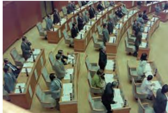
消費税関連条例の起立採決。与党 (手前) は共産党の反対で割れた。(平成9年3月26日沖縄タイムス)