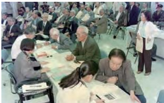
沖縄の厚生年金加入者を対象にした特別措置がスタート。沖縄特例加入手続窓口で雇用経歴認定を受ける人々＝那覇市内 (平成7年4月8日沖縄タイムス)