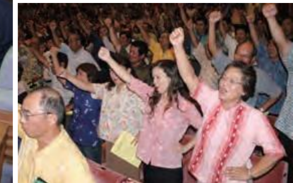
9月29日、県立北部病院産婦人科の再開と存続を求めた北部12市町村総決起大会=名護市民会館

この年、県立北部病院の産婦人科が休止になり、県立宮古・八重山病院でも脳外科医の確保が厳しい状況となるなど、県民に医師不足への不安が広がっていた。