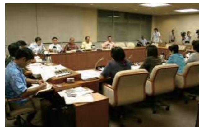
後期高齢者医療制度の廃止を求める陳情をめぐり、14日深夜まで白熱した討論が続いた文教厚生委員会。同陳情は、可否同数となり委員長裁決で採択された。終了は午後11時57分であった。(平成20年7月16日沖縄タイムス)