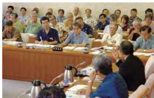
談合問題の対応について要請決議案を可決した土木委員会(平成18年7月8日琉球新報)

決議で、県が企業に科す県発注工事談合に対する巨額の損害賠償金の支払いが県経済にも極めて大きな影響を及ぼすことが懸念されると指摘した。損害賠償金の請求は125社、総額約84億円