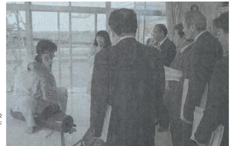
陳情に関する調査のため県立泡瀬養護学校名護分校を訪れ、父母や職員から話を聞き、訓練に取り組む生徒を励ます文教厚生委員会の委員ら(平成10年12月3日沖縄タイムス)