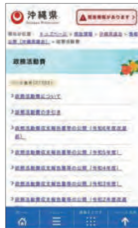
過去5年の収支報告書が閲覧できる県議会ホームページ

3月26日、議員提出の沖縄県政務調査費の交付に関する条例の一部改正条例議案が全会一致で可決された。