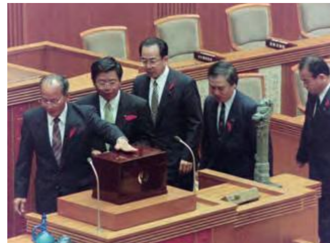
吉元政矩副知事の再任案件をめぐって無記名投票する議員ら (平成9年10月17日沖縄タイムス)

第5回議会 (定例会) に提出された吉元政矩副知事の再任に係る同意議案は、無記名投票の結果、有効投票中賛成20票、反対21票、わずかに1票差で「否決」となった。第7回議会 (定例会) に再度提案されたが、再び否決となり、大田昌秀知事は吉元政矩氏の再任を断念することとなった。