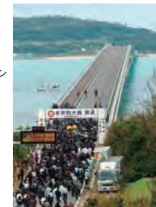
古宇利大橋の開通式(平成17年12月21日琉球新報)