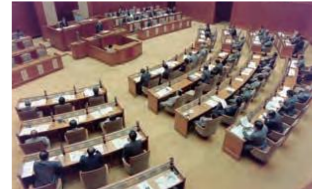
全県FTZの県素案について協議するため開かれた全員協議会 (平成9年9月25日沖縄タイムス)