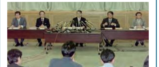
11月22日、普天間飛行場の移設先を名護市辺野古沿岸域と発表する稲嶺恵一知事=県庁 (平成11年12月30日沖縄タイムス)