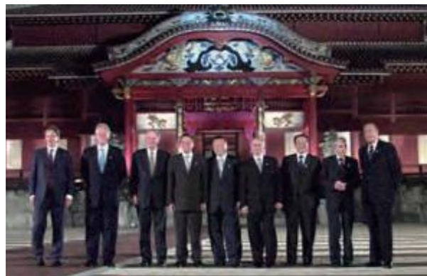
九州・沖縄サミットに出席する森喜朗首相 (中央) から主要8か国の首脳 (平成12年12月26日沖縄タイムス)