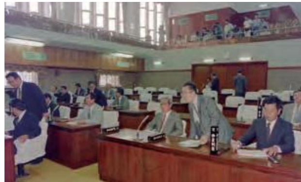
旧議会棟最後の本会議(平成4年7月15日沖縄タイムス※日付は新聞掲載日。以下同じ。)