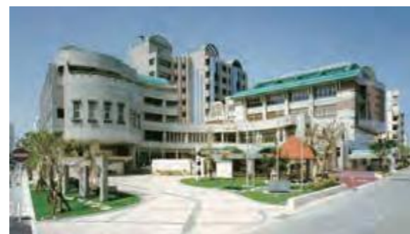
完成した沖縄県女性総合センター (現在の沖縄県男女共同参画センター) 「ているる」