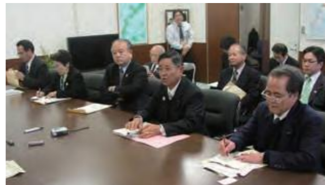
2月15日、沖縄防衛局を訪れ、米兵による暴行事件に抗議する米軍基地関係特別委員会の委員ら(平成20年2月16日沖縄タイムス)