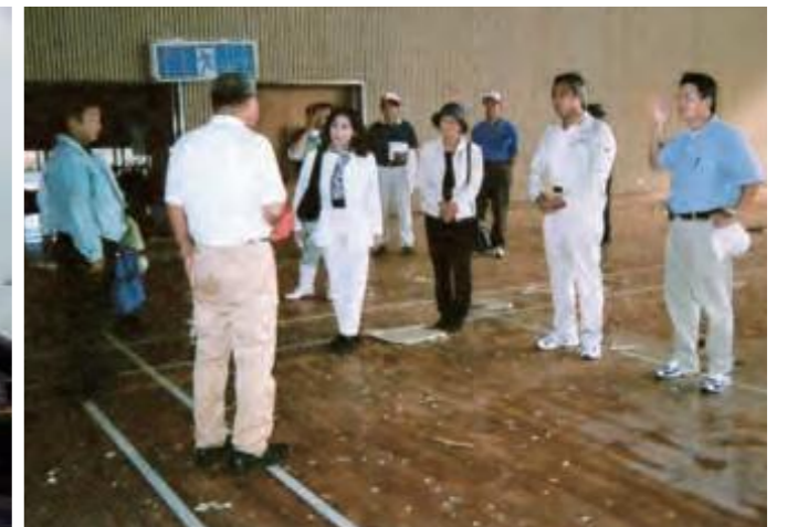
9月13日、宮古島の台風被害調査を行う文教厚生委員会の委員ら。屋根が吹き飛び、床は浸水した雨水や窓ガラスの破片などが散乱する上野村体育館