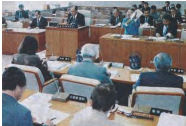
12月18日、税制改正の評価について活発な質疑が展開された沖縄振興特別委員会(平成13年12月24日沖縄タイムス)