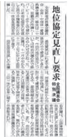
全国議長会における特別決議を伝える記事(平成15年10月29日琉球新報)