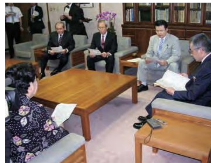
医師の確保を求める決議を嘉数昇明副知事(右)に要請する文教厚生委員会の委員ら(平成17年4月13日琉球新報)

この年、県立北部病院の産婦人科が休止になり、県立宮古・八重山病院でも脳外科医の確保が厳しい状況となるなど、県民に医師不足への不安が広がっていた。