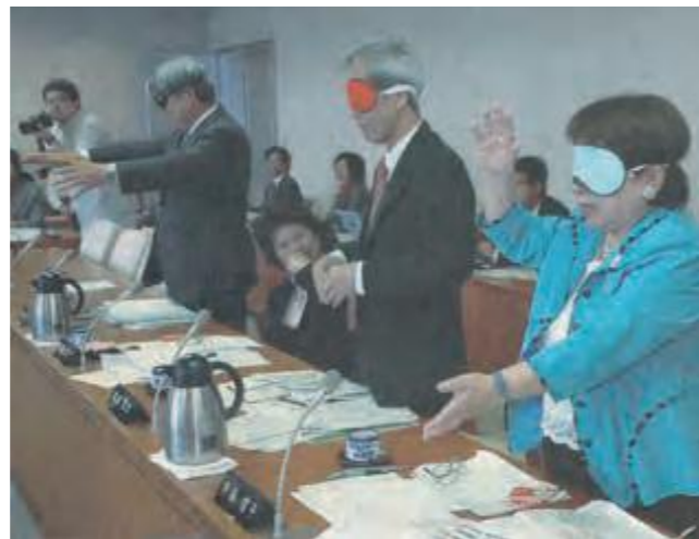
県立沖縄盲学校に係る審査の参考とするため、参考人の出席を求めた文教厚生委員会。参考人から意見を聴取し、実際にアイマスクをつけて体育の授業を体感する委員ら(平成20年3月21日琉球新報)