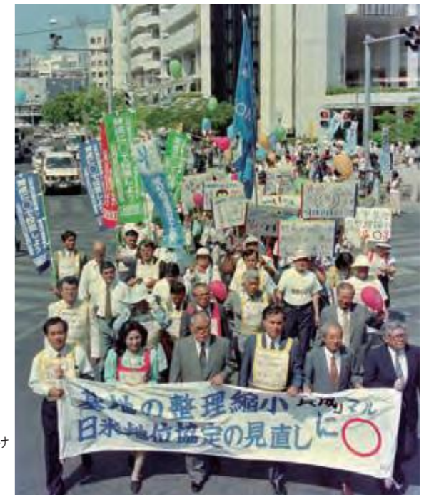
「出陣式」の後、県民投票成功を呼び掛け国際通りをパレードする那覇地区推進協 (平成8年8月29日沖縄タイムス)

県民投票は、9月8日に実施され、投票率は59.53%で、賛成者が全有権者の53%に達する結果となった。