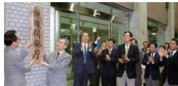
「沖縄開発庁」の看板が取り外された。(平成13年12月27日沖縄タイムス)