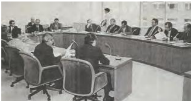
資産公開条例のモデル案を審査した議会運営委員会。本条例案は9月22日の本会議で可決、11月から施行された。(平成7年9月2日沖縄タイムス)