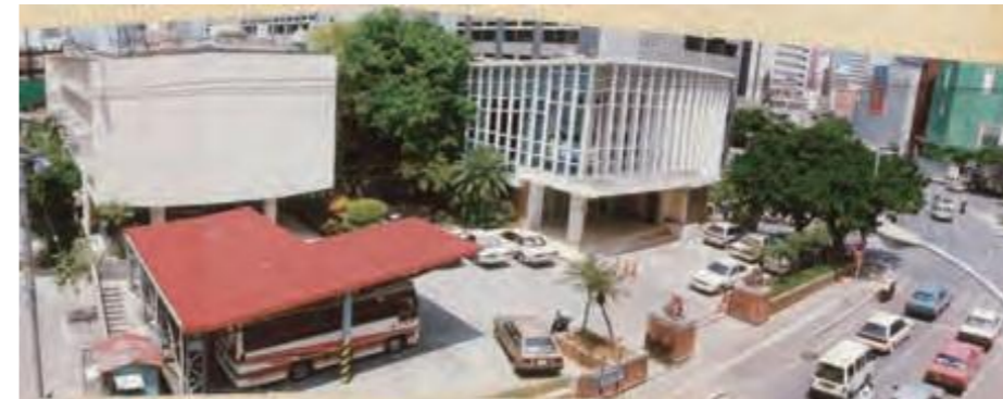
旧議会棟の全景。中央の白い建物2階に議場があった。建物後方に沖縄県庁の行政棟、その右後方にパレット久茂地が見える。

旧議会棟をめぐるのは、保存運動が起き、県議会には請願や陳情が提出され、平成6年には「旧議会庁舎耐久性調査報告書に係る住民訴訟」が提起された。旧議会棟は平成11年に撤去されたが、解体工事後は跡地に記念碑が建立されている。