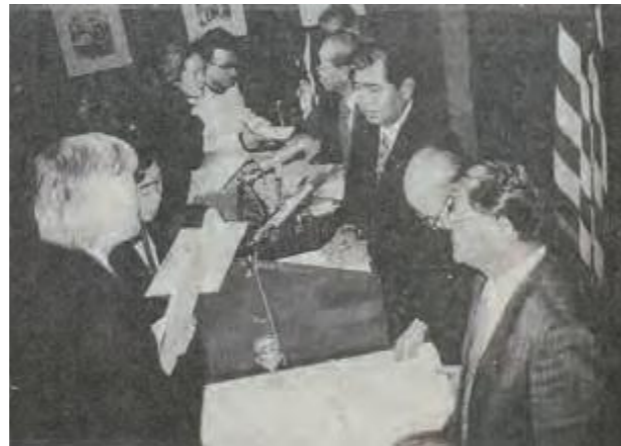
記者会見が終了しても記者団に囲まれ、質問を受ける要請議員団=1月31日ナショナル・プレスクラブ

米軍基地の整理縮小や日米地位協定の見直し等の諸事項を要請するために県議会独自で、米国に議員団 (13人) を派遣した。