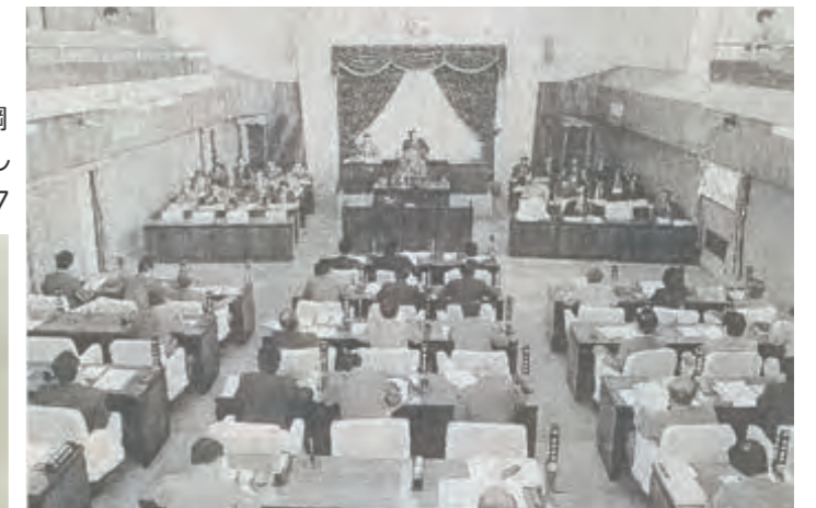
3次振計素案について質疑する全員協議会=旧議会棟議場(平成4年7月17日)