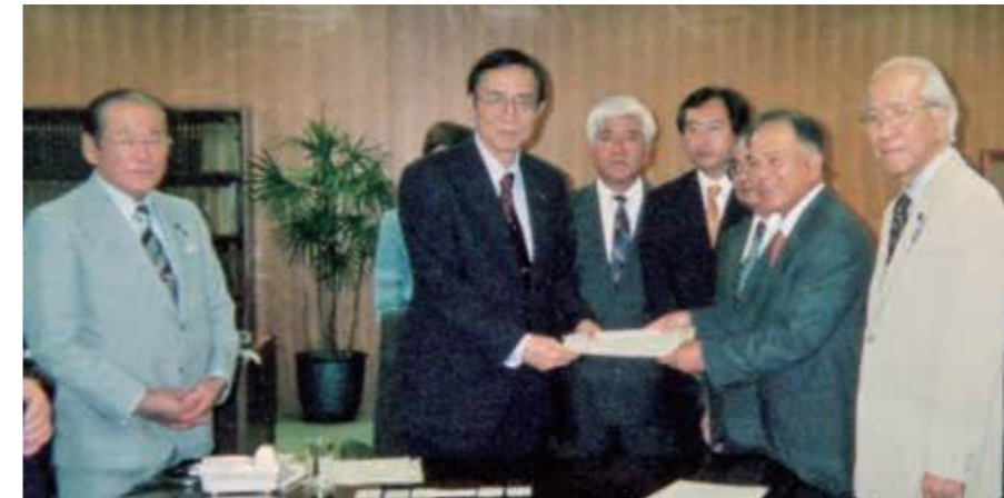
7月22日~24日、内閣総理大臣をはじめ法務大臣、外務大臣、防衛庁長官などに対して、決議された「日米地位協定の見直し」等の要請を行った議員団。(左から)仲村正治衆議院議員、細田博之沖縄及び北方対策担当大臣

7月には全国知事会が、10月には全国都道府県議会議長会(本県開催)が日米地位協定見直しの特別決議を行った。