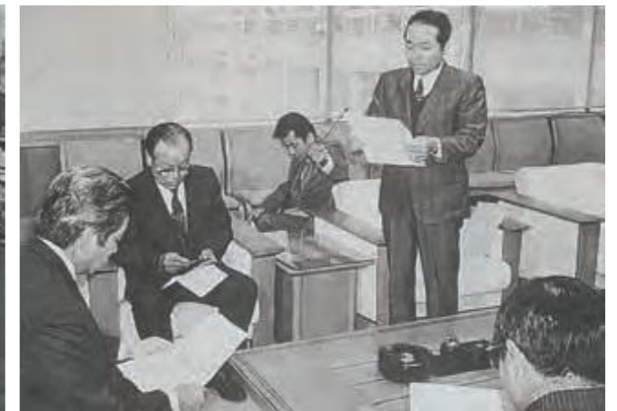
新石垣空港建設問題に関して、県議会へ宮良案の早期着工を求める陳情者(平成5年3月11日琉球新報)