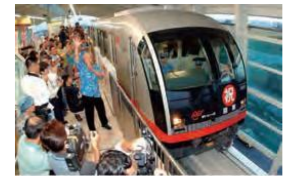
開通したゆいレール(平成15年12月24日琉球新報)