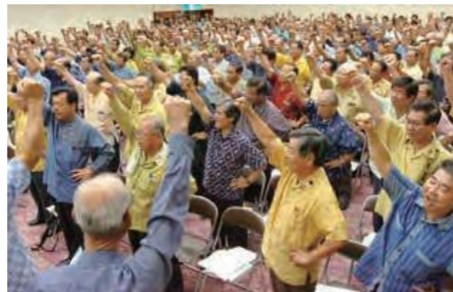
地方自治危機突破総決起大会の参加者ら(平成18年6月18日琉球新報)

この年、政府において、地方交付税の削減などが議論され、地方自治体では、国の方針による地方財源の急激な削減と分権改革の停滞への危機感が高まっていた。