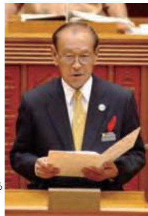
就任後初の議会で代表質問に答える仲井眞弘多知事(平成18年12月15日琉球新報)