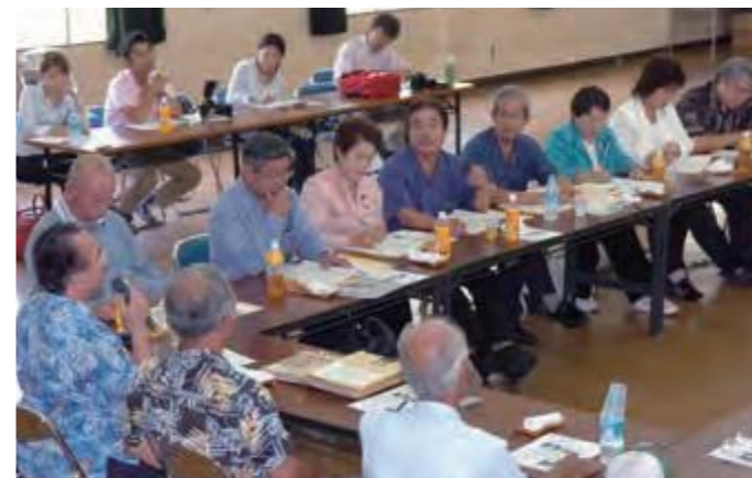
7月7日、「集団自決」の状況などを証言する体験者に質問する文教厚生委員会の委員ら