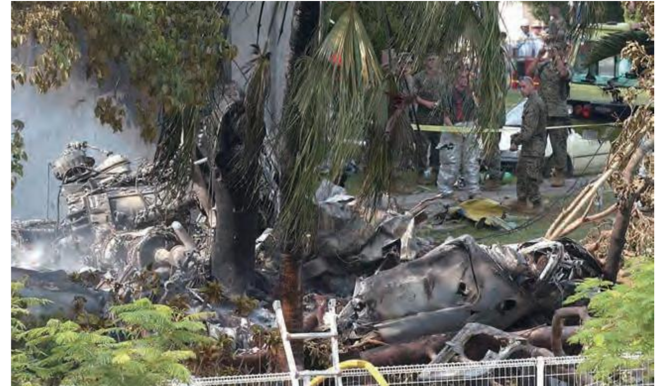
8月13日、米海兵隊のCH-53D大型ヘリが墜落し、黒煙に包まれる沖縄国際大学