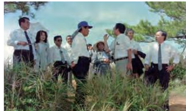
前年12月、SACO最終報告で返還同意された米軍施設のうちの一つ、ギンバル訓練場を視察調査する軍用地返還・跡利用対策特別委員会の委員ら (平成9年8月5日沖縄タイムス)