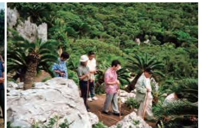
7月16日、国頭村内の自然公園法違反の現場を調査するため、杖をついて山道を歩く文教厚生委員会の委員ら