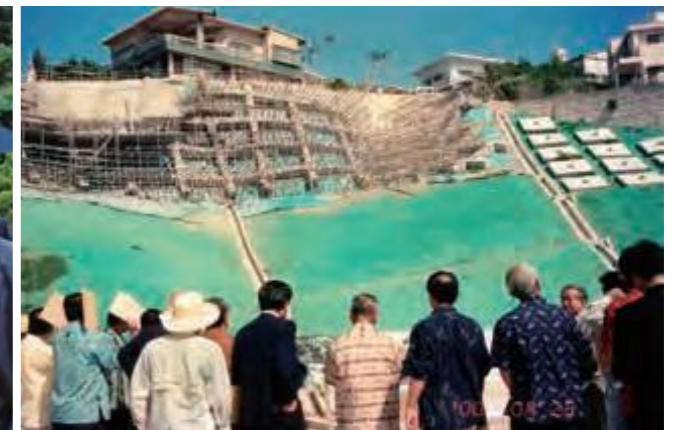
10月2日、南風原町兼城の地滑り対策工事現場を視察調査する土木委員会の委員ら