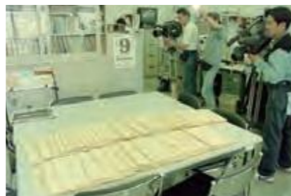
不動産や預金など県民に初めて公開された知事と県議会議員の資産公開資料=県議会事務局 (平成8年4月9日沖縄タイムス)