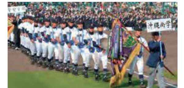
2度目の優勝を果たした沖縄尚学高校ナイン(平成20年12月24日琉球新報)