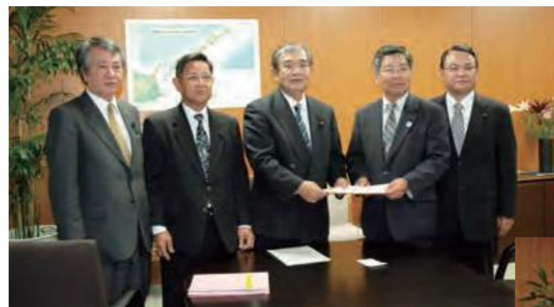
4月6日、内閣府を訪れ、大学院大学の早期開学が財政面の制約と研究者招へいの困難さから憂慮され、嘉数知賢内閣府副大臣(中央)に要請する議員ら