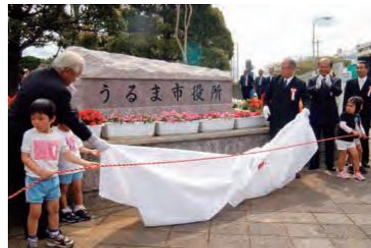
うるま市の誕生を祝う関係者ら

財政上、制度上のさまざまな優遇措置が盛り込まれた合併特例法の適用期限が平成17年3月31日までとなっていたこの年、市町村合併が相次いだ。