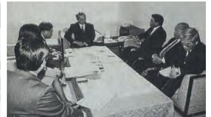
航空運賃低減について要請する県議会代表ら＝沖縄開発庁事務次官室 (平成7年1月13日琉球新報)