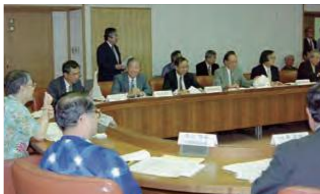
沖縄サミットの準備態勢について情報交換が行われた第3回沖縄県サミット推進本部。会議には県議会事務局を含めた庁内全部局が参加した。