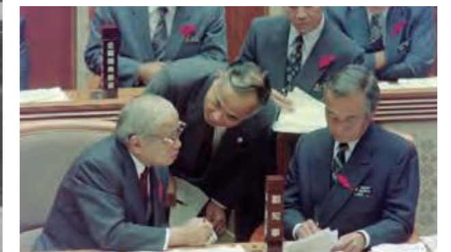
新石垣空港建設問題を巡り、答弁調整を行う大田昌秀知事(左)と仲井眞弘多副知事(右)ら(平成4年10月3日沖縄タイムス)

宮良案に反対する地元住民の反対運動に発展した。県議会では、新石垣空港建設等に関連する諸問題の調査並びに対策の樹立のため、10月8日に特別委員会を設置し、同問題に対処した。