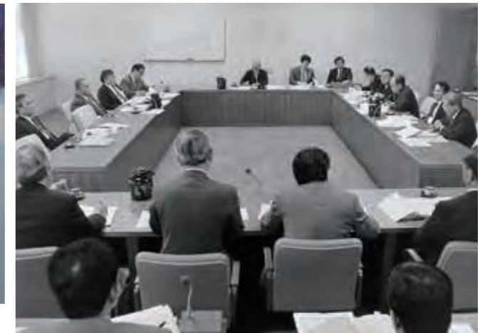
名護市辺野古のシュワブ基地で起きたヘリ墜落事故、出砂(いりすな)鳥射撃場の使用条件違反について、臨時会の招集請求及び抗議決議の提出を確認した米軍基地関係特別委員会 (平成6年11月23日沖縄タイムス)