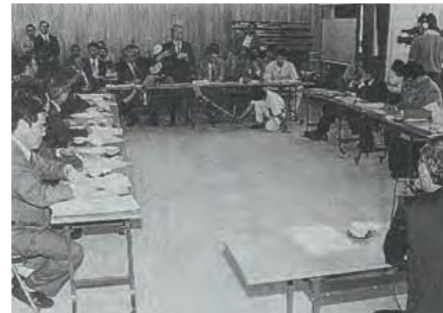
新石垣空港建設問題に関して関係団体に意見聴取を行う新石垣空港対策特別委員会の委員ら=県八重山支庁(平成5年2月17日琉球新報)