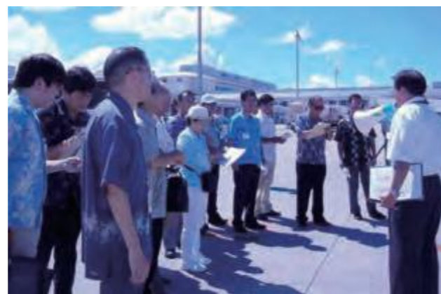
9月3日、中華航空機炎上事故現場を視察調査する総務企画委員ら