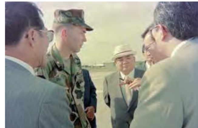
米軍F15戦闘機が墜落し、普天間基地内で米軍将校から事故の状況を聴く、米軍基地関係特別委員会の委員ら (平成6年4月8日沖縄タイムス)