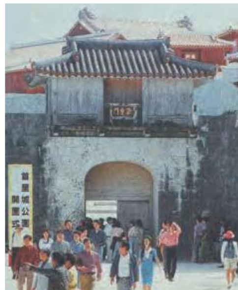
開館を翌日に控え、首里城歓会門を訪れる人々(平成4年11月2日琉球新報)