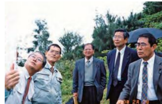
2月2日、新石垣空港建設候補地の現地調査を行う新石垣空港対策特別委員会の委員ら