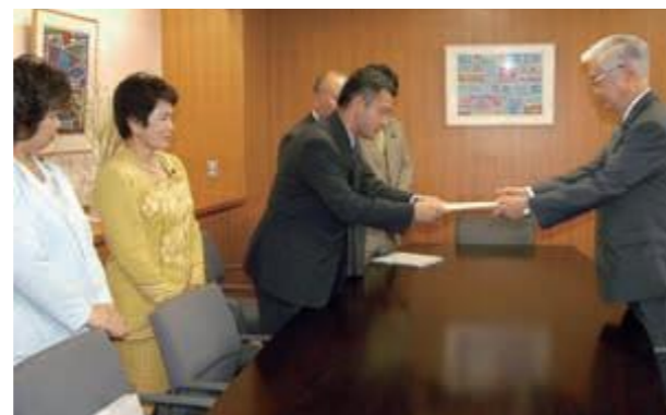
新石垣空港整備の事業化を求め、佐藤正紀内閣府審議官(右)に決議を手渡す県議会の要請団(平成16年7月29日琉球新報)

県議会として、沖縄振興計画の推進などに支障が生じないように、必要な措置が図られるよう要請した。