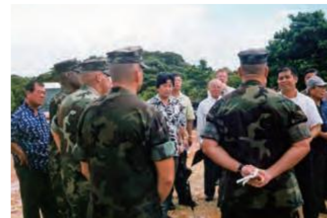
8月5日、米海兵隊キャンプ・シュワブ演習現場を視察調査する米軍基地関係特別委員会の委員ら