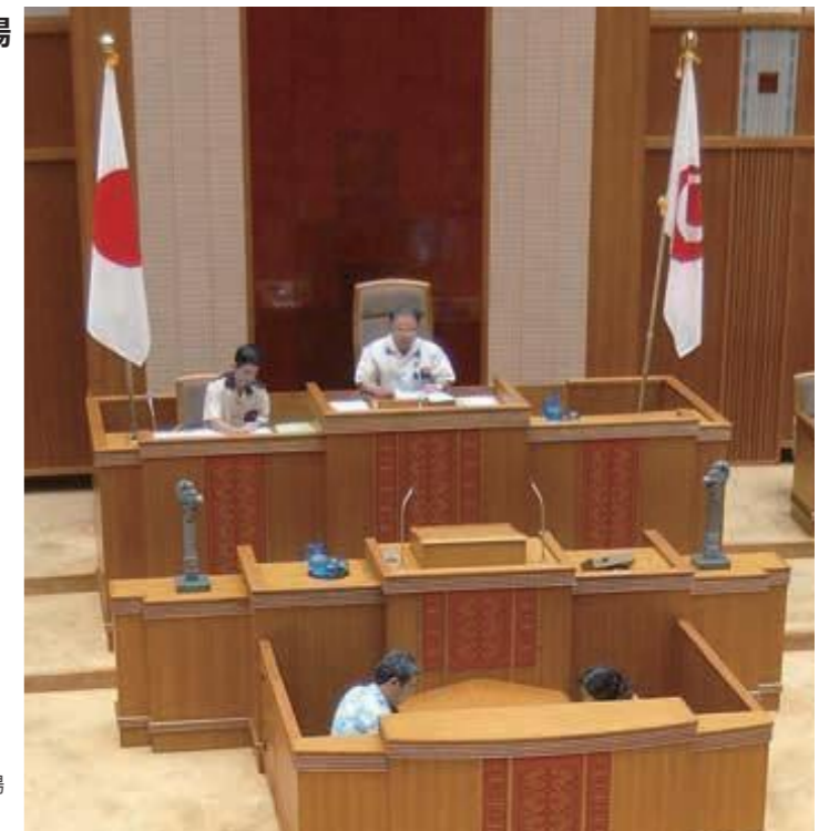
第4回議会(定例会)最終日、日の丸が掲揚された議場(平成13年10月15日)