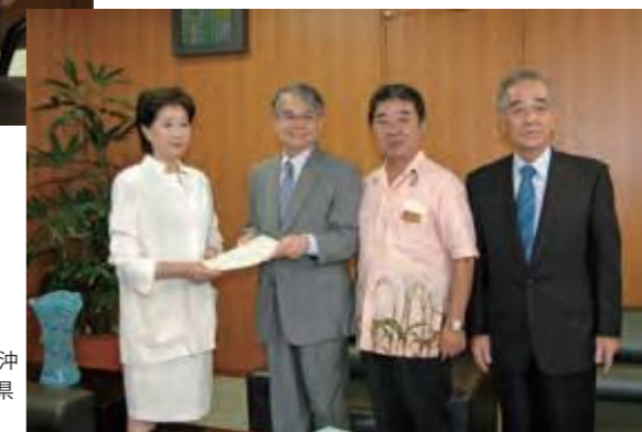
2007年産さとうきびの政策支援が決定されるのを前に、小池百合子冲担当相(左)に要請書を手渡す稲嶺恵一知事と県議会の会派代表、県サトウキビ対策本部の要請団(平成18年7月14日琉球新報)