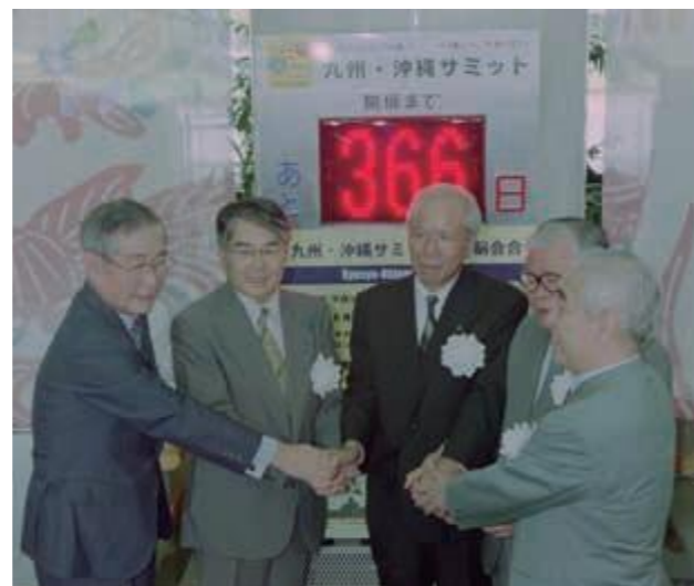
沖縄サミット開催までの残歴版の前で、成功を誓い握手する関係者ら (右から) 崎間県商工会議所連合会会長、親泊康晴市長会長、友寄信助県議会議長、稲嶺恵一知事、野村一成沖縄担当大使 (平成11年7月22日沖縄タイムス)