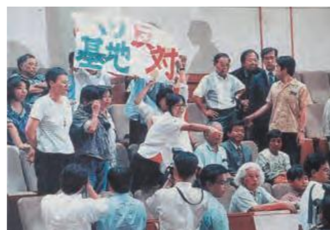
10月15日、市民団体も詰め掛け早朝まで傍聴=本会議場傍聴席

10月14日、県議会自民党会派などの議員26名から提出された「普天間飛行場の早期県内移設に関する要請決議」を審議した。