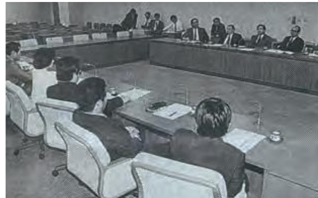
当時の県議会議員1期生による超党派勉強会(平成5年1月17日琉球新報)

県政の課題について、講師を招いて研鑽を深め意見を交換しようというもので、初の取り組みであった。初会合には、与野党15人の新人議員のうち13人が出席した。