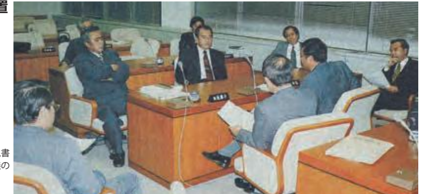
自由貿易地域対策特別委員会終了後、意見書の文案を協議する各会派の代表者ら。協議の結果、意見書の提出を全会一致で決めた。(平成9年10月17日沖縄タイムス)

9月26日、県議会では、自由貿易地域制度に関する諸問題の調査及び対策の樹立を議論するため、22人の委員をもって構成する特別委員会を設置した。