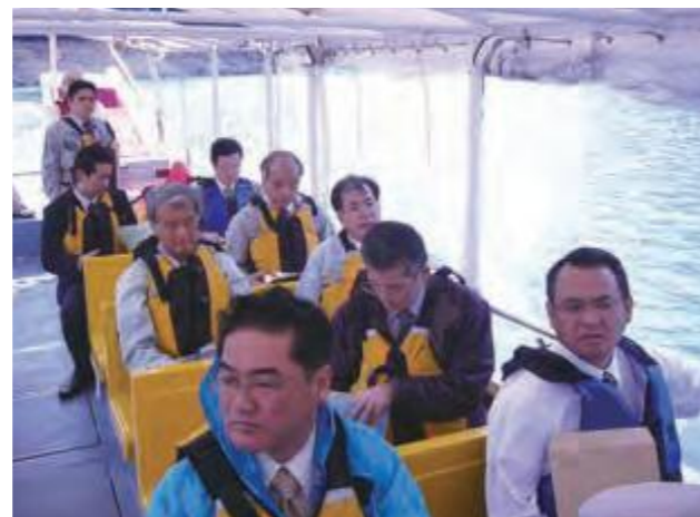
2月6日、福地ダム等でのペイント弾等の発見に関する現場調査を行う議員ら＝福地ダム