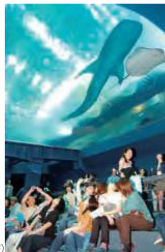
オープンした美ら海水族館(平成14年12月25日琉球新報)