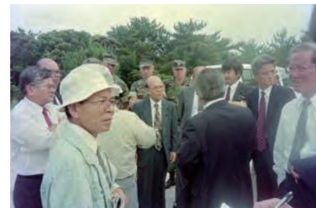
パラシュート降下訓練予定地で説明を受ける米軍基地関係特別委員会の委員ら＝キャンプ・ハンセン演習場 (平成7年6月15日沖縄タイムス)