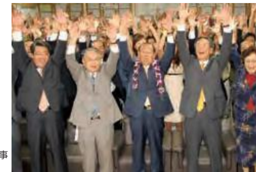
11月19日、初当選して喜ぶ仲井眞弘多新知事(平成18年12月25日琉球新報)