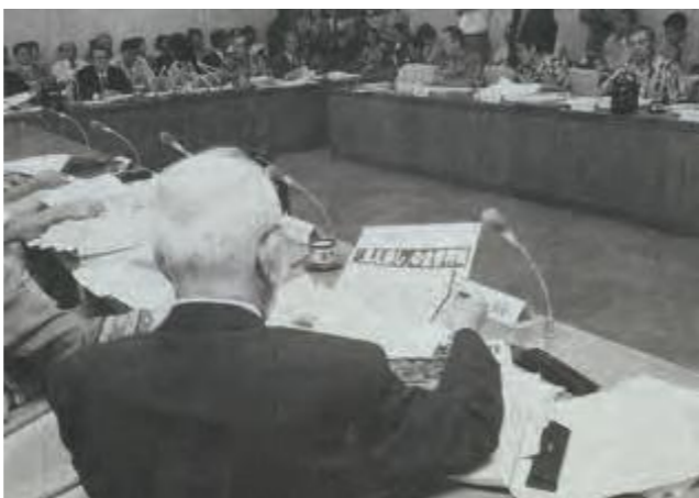
集中審査を行った文教厚生委員会。傍聴席も満席であった。(平成11年10月8日琉球新報)