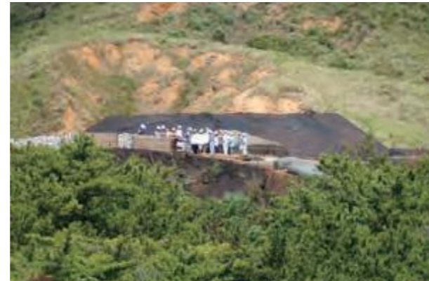
金武町伊芸区のキャンプ・ハンセン内の米陸軍複合射撃訓練場建設現場を調査する米軍基地関係特別委員会の委員ら。この後、陳情を提出した金武町と伊芸区民から話を聞いた。(平成16年9月13日琉球新報)