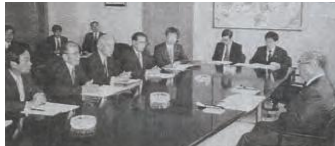
厚生年金問題で小里貞利沖縄開発庁長官に要請する県議会代表=22日、沖縄開発庁

県議会では、11月15日に基金の造成に対する国の助成措置を求め意見書を可決、代表議員団を東京都に派遣し要請活動を行った。