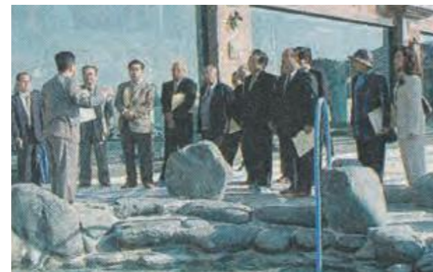
北部振興策などの各事業を視察する沖縄振興特別委員会の委員ら この後、建設中の国立沖縄工業高等専門学校の視察調査、名護市から金融・情報特区の整備状況等について説明を受けた。 (平成15年1月10日琉球新報)