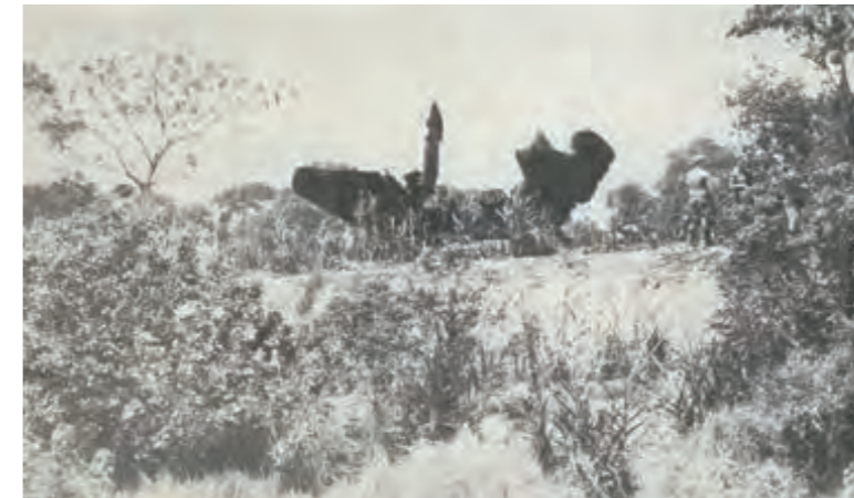
尾翼を突き出した形で墜落し炎上、焼け落ちた墜落機

県議会では、その都度、意見書と抗議決議を可決し、代表議員団を東京都に派遣して抗議するとともに、事故の再発防止を強く求めるなどの活動を行った。