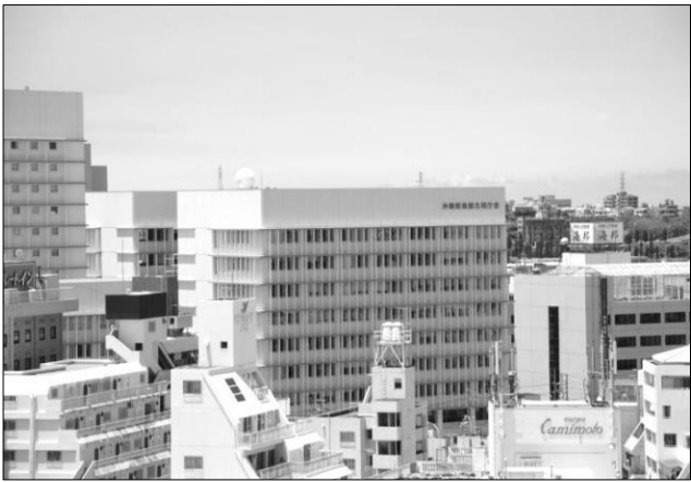
沖縄県南部林業事務所（沖縄県南部合同庁舎 5 階）