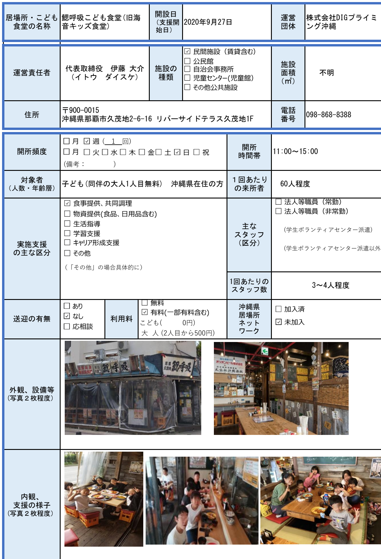
様式1 こどもの居場所・こども食堂実施状況（個票）