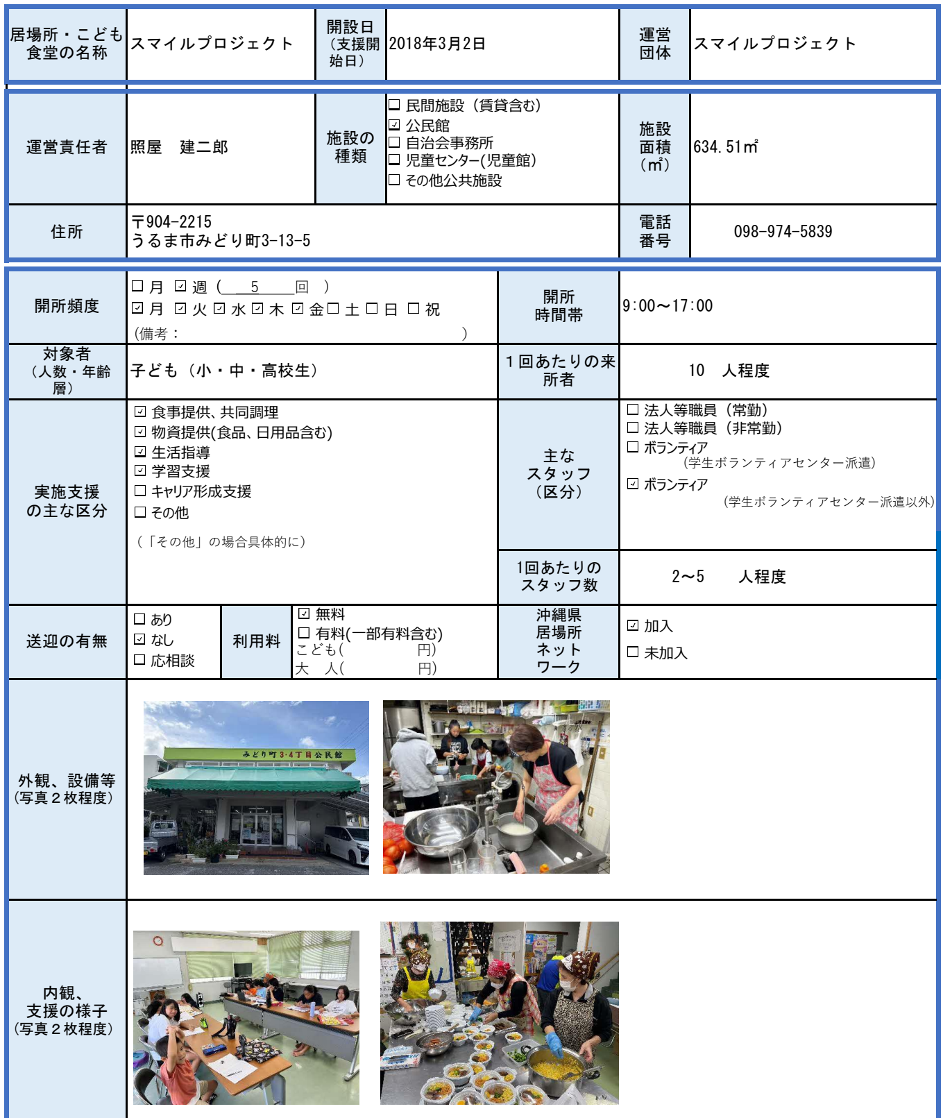
様式 1 こどもの居場所・こども食堂実施状況（個票）