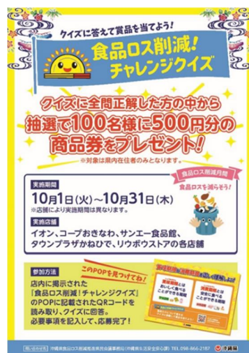
イベント周知チラシ