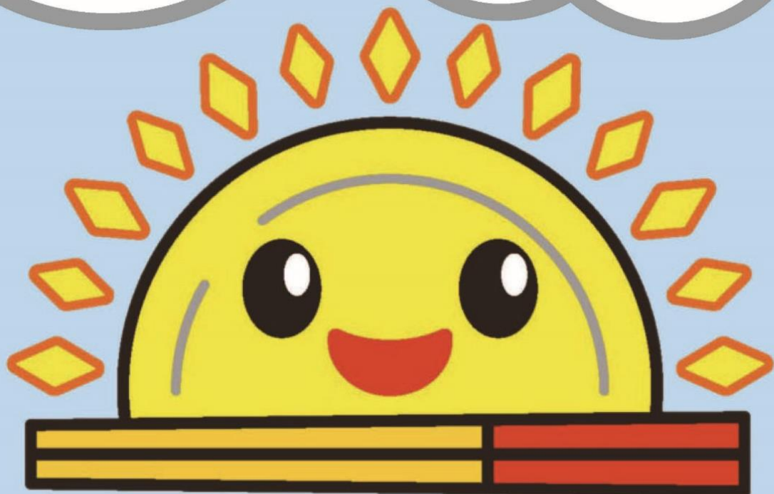
沖縄県食品ロス削減県民運動ロゴマーク