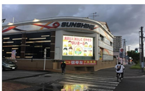
デジタルサイネージ