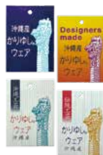
かりゆしウェアの下げ札

であることです。沖縄県衣類縫製品工業組合は、かりゆしウェアの製造に必要な設備と技術を有する事業者に対して、その証明として「かりゆしウェア」の下げ札を発行しています。