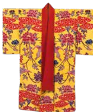
少年用の冬の紅型衣裳。 黄色地牡丹尾長鳥霞文様紅型縮衿衣裳