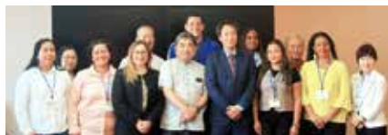
JICA 国別研修員による池田副知事訪問の様子