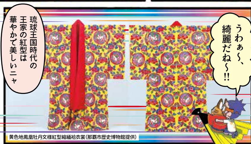
黄色地鳳凰牡丹文様紅型縮緬衤衣裳