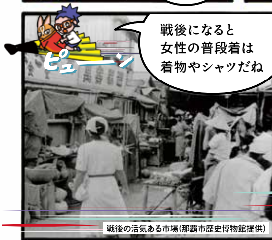
戦後の活気ある市場