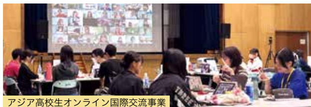
アジア高校生オンライン国際交流事業

を交わしました。これらの取組が、歴史を学び未来を描く若者の国際的な絆を深め、世界平和につながっていくことを切に願っています。