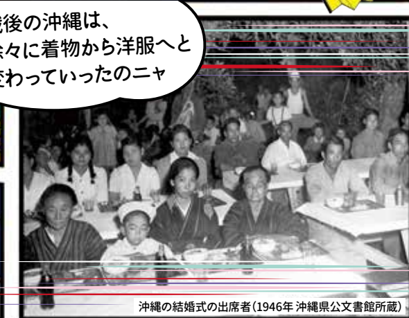
沖縄の結婚式の出席者(1946年)