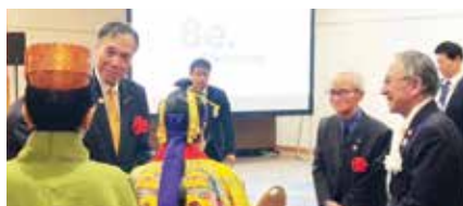
長野県阿部知事、玉城知事、沖縄芸能関係者の交流

沖縄県と一般財団法人沖縄観光コンベンションビューローは、長野県で「沖縄観光感謝の集い」を開催しました。長野県の阿部守一知事をはじめとする行政・観光業界関係者をお招きし、沖縄県の観光振興へのご協力に感謝を伝え、令和8年の沖縄県の主な観光振興の取組について紹