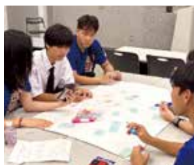
沖縄県高校生海外雄飛プロジェクト

校生とハワイ州の高校生の交流事業を継続しており、戦後80年の節目を迎えた今年は2月と6月に平和学習を実施しました。2月には県内高校生20名をハワイ州に派遣し、現地高校生や県人会との交流のほか、パールハーバーでの学習を通じ、沖縄とハワイの悲惨な歴史から復興、そして未来について共に学びました。6月にはハワイ州の高校生15名を沖縄に招き、対馬丸記念館や沖縄平和祈念資料館の訪問を企画。さらに、過去を振り返り未来志向で平和を考えるワークショップを本県高校生が主導し、双方の高校生が活発に意見