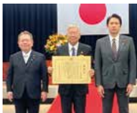
左から、酒井国交副大臣、大城副知事、加藤国交大臣政務官

国土交通省にて行われた表彰式に大城副知事が出席しました。県は、過度な自家用車依存から路線バス利用への転換促進のため、平成24年に「わった〜バス党」を発足しました。同党は、多様な企業・団体・個人の参画のもと、「バスレーンの延長」、「交通系にカードの導入」などの施策と