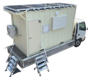
車載型ソーラーハウス