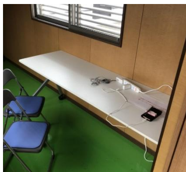
スマホ等の 充電ステーションとして