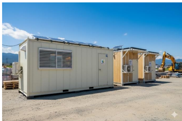
建設現場などの休憩所やトイレとして