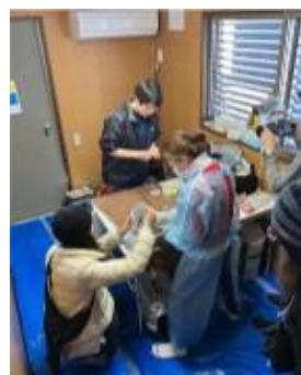
医療関係者控室 として