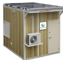
ソーラーバイオトイレやすらぎ