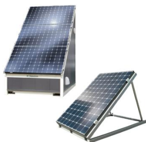
工事不要の補助パネル(大)