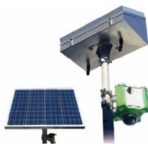
補助パネル(小)+防犯カメラ(G-Cam)