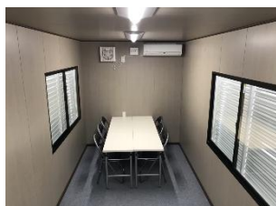
研修室やコワーキングスペースとして