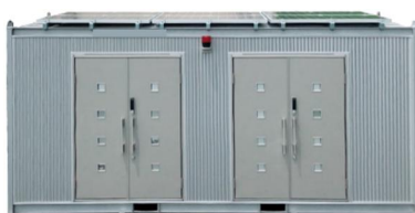
ソーラー備蓄倉庫 SORACLE