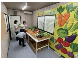
イベント時の販売所として