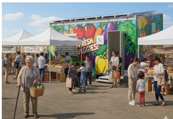
各種イベント時の運営事務局・受付として