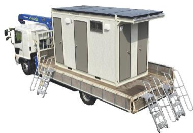
車載型ソーラートイレさざなみ