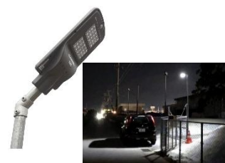
ソーラー街路灯 DT ライト