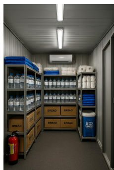
備蓄(食糧) 倉庫として