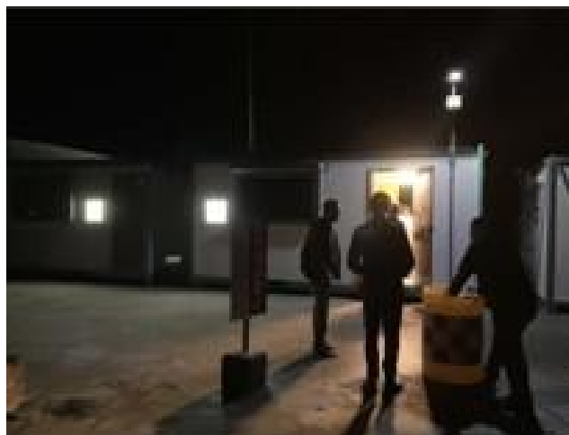
一帯が停電しても商用電源いらず 災害対応、ケアの手を止めません