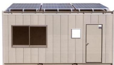
ソーラーシステムハウス