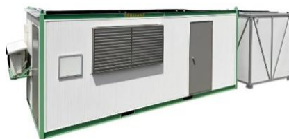
ソーラーハウス+トイレ かつろぎ