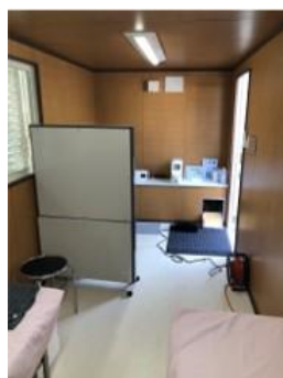
ベッド・パーテーション 設置可能。救護所として