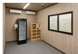
コインロッカーや更衣室など